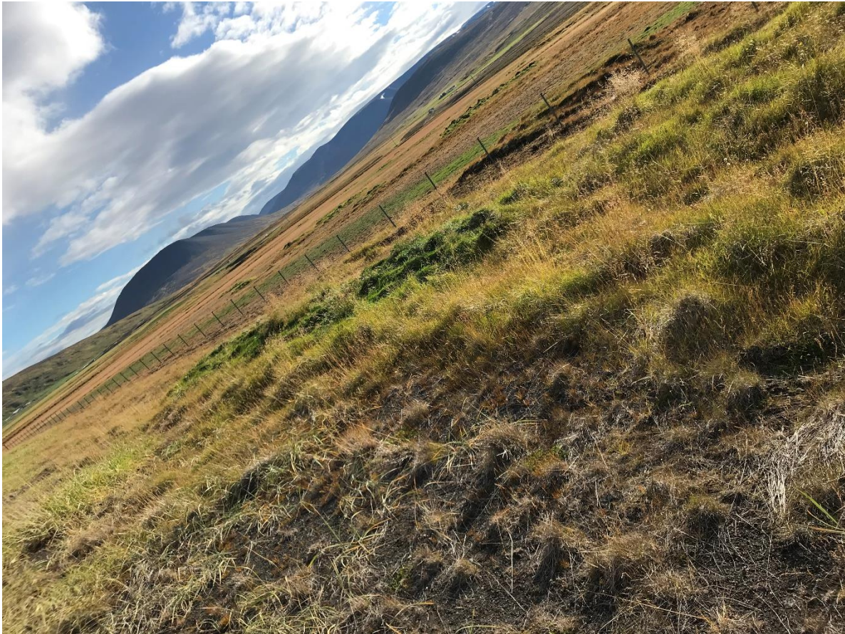
Mynd 2. Horft til norðausturs yfir tóftina. (1914-64).