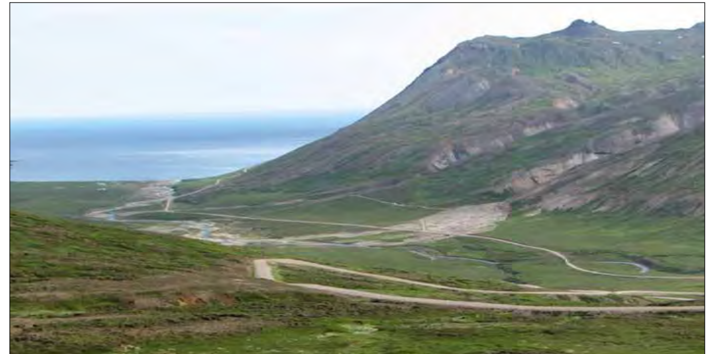
Borgarfjarðarvegur (94) um Njarðvíkurá, séð yfir útbodskafli. Mynd: Hafðís E. Jónsdóttir, júlí 2011.

Við uppgræðslu verður farið eftir leiðbeiningum Vegagerðarinnar um gróðurhönnun á vegsvæðum í dreifbýli. Sáð verður í vegkanta og vegfláa á grónu landi. Áður en sáð er þarf að