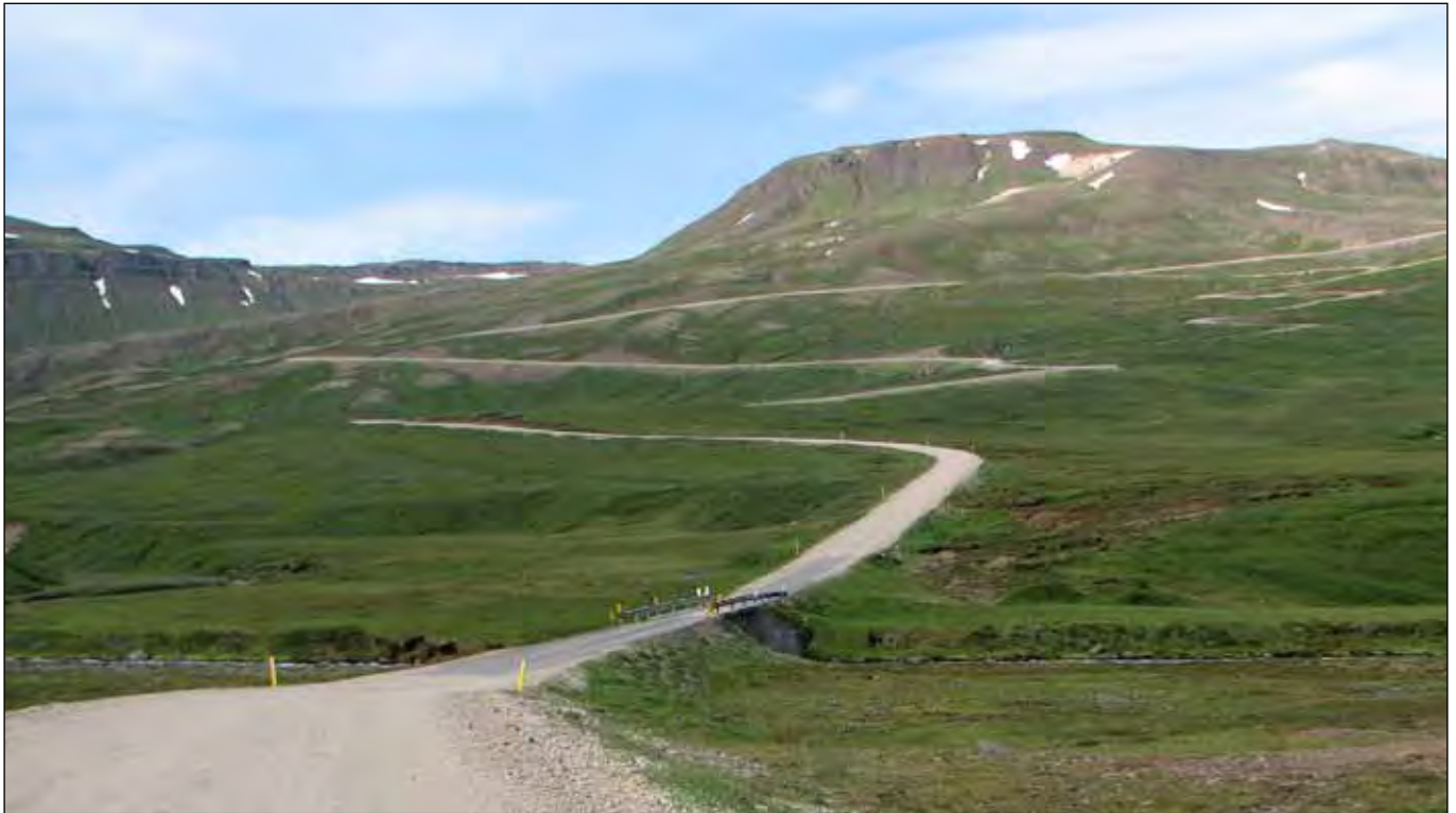
Borgarfjarðarvegur (94) um Njarðvíkurá, vestari hluti útboðskafla. Á myndinni má sjá hvar vegurinn liggur upp á Vatnsskarð. Mynd: Hafdís E. Jónsdóttir, júlí 2011.