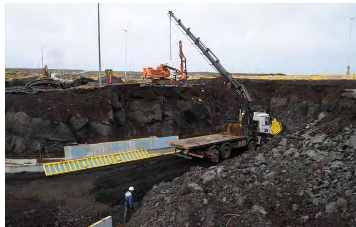
Reykjanesbraut (41), undirgöng við Straumsvík. Verktaki: Suðurverk ehf. Verki á að vera lokið í júlí. Mynd tekin 28. mars.

Nokkur ræsi eru í núverandi vegi á umræddum köflum og verður þeim öllum skipt út. ■