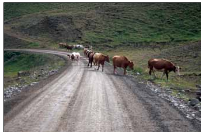
Eyjaafjarðarbraut vestri (821), tengivegur.