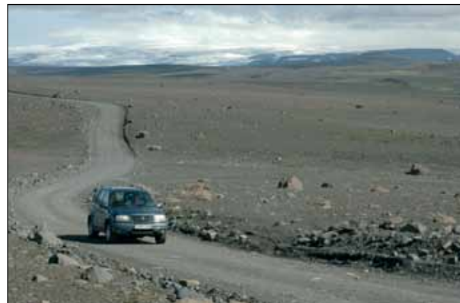
Kjalvegur (35), stofnvegur um hátendi.