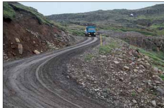
Mjóafjarðarvegur (953), tengivegur.