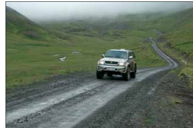
Ingjaldssandsvegur (624), héraðsvegur.