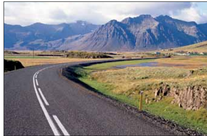
Hringvegur (1) í Suðursveit, stofnvegur.