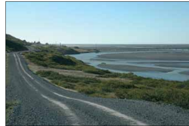
Vegur að Grænuhlíð í Lóni, héraðsvegur.

Landsvegir eru vegir yfir fjöll og heiðar sem ekki tilheyra neinum af framangreindum vegflokkum og aflagðir byggðavegir á eyðilendum. Á vegum þessum skal yfirleitt einungis gera ráð fyrir árstíðabundinni umferð og minna eftirliti og minni þjónustu en á öðrum þjóðvegum.