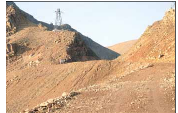
Skarðsvegur (793) Siglufjarðarskarð, landsvegur.