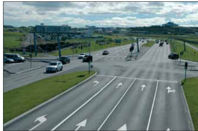
Nesbraut (49) í Reykjavík (Hringbraut), stofnvegur.

Tengivegir eru vegir utan þéttbýlis sem liggja af stofnvegi á stofnveg eða af stofnvegi á tengiveg og eru a.m.k. 10 km langir, vegir sem tengja landsvegi við stofnvegi, vegir sem ná til þéttbýlisstaða með færri en 100 íbúa og tengja þá við stofnvegakerfið, vegir að helstu flugvöllum og höfnum sem mikilvægar eru fyrir flutninga og ferðaþjónustu, og vegir að ferjuhöfnum ef þeir eru ekki stofnvegir, vegir að þjóðgördum og innan þeirra og vegir að fjölsóttum ferðamannastöðum utan þéttbýlis. Þar sem tengivegur endar í þéttbýli skal tengja hann fyrstu þvergötu sem tilheyrir vegakerfi þéttbýlisins og enda þar.