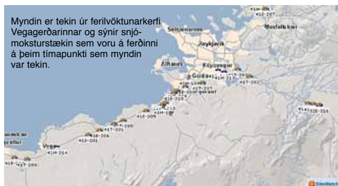
Myndin er tekin úr ferilvöktunarkerfi Vegagerðarinnar og sýnir snjó-moksturstaekin sem voru á ferðinni á þeim tímapunkti sem myndin var tekin.

Vetrartíðin hefur ekki farið framhá nokkrum manni þessa síðustu daga. Hjá Vegagerðinni verða starfsmenn áþreifanlega varir við veturinn þegar veðrið hamast sem mest. Og það gengur þá stundum mikið á.