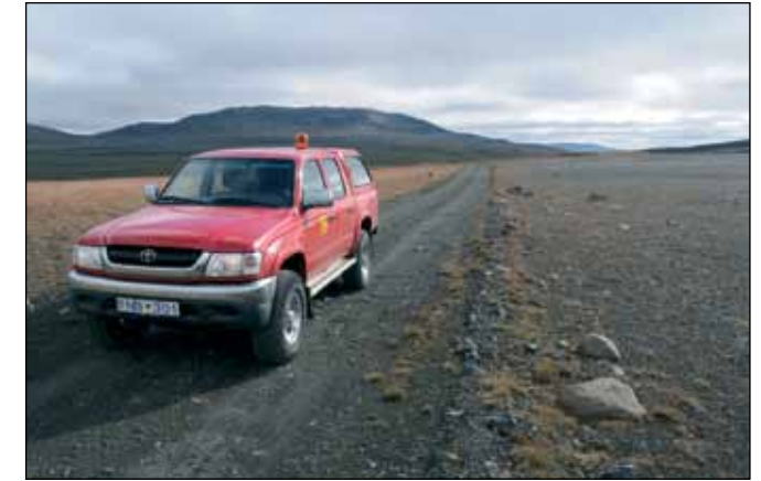
Brúarvegur (907), landsvegur.