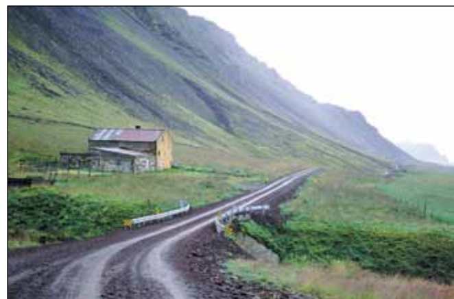
Klofningsvegur (590), tengivegur.