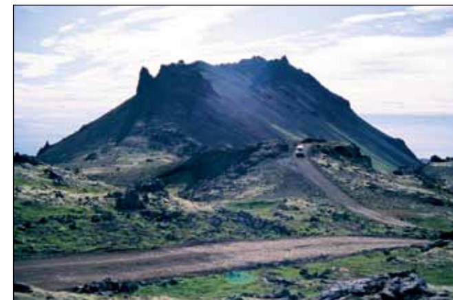
Jökulhálsleið (570), landsvegur.