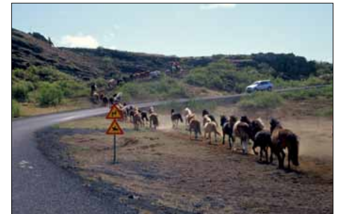
Reiðvegur við Kaldadalsveg (550) hjá Bolabás.