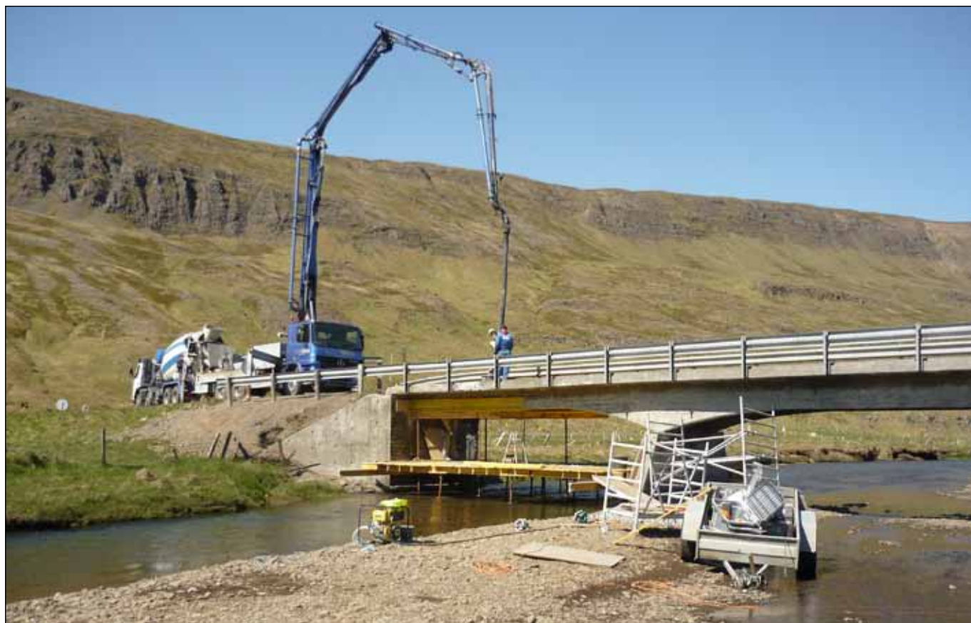
Í vor voru boðin út nokkur verkefni í viðhaldi brúa á Vestfjörðum. Þessi verk eru nú í gangi og var myndin tekin við steypuvinnu á brú yfir Tunguá í Bitrufirði í lok júní.