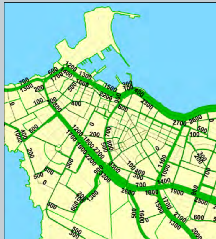
Spá morgunn, 2024

Tilgangur verkefnisins var að þróa umferðarlíkan fyrir háannatíma, í framhaldi af þróun nýs umferðarlíkans höfuðborgarsvæðisins. Háannatímaumferð er sú umferð sem nánast öll hönnun innanbæjar miðar við. Niðurstöður verkefnisins voru að umferðarspár háannatímalíkans eru af svipuðum gæðum og umferðarspár sólhringslíkans. Einnig kemur fram að hægt væri að bæta gæði spáa til dæmis með ítarlegri ferðavenjukönnun. Þá er nefnt að gríðarlega mikilvægt sé að fá upplýsingar um starfajölda í hverjum reit, sem notaður er í líkaninu en til þess eru nokkrar aðferðir mögulegar.