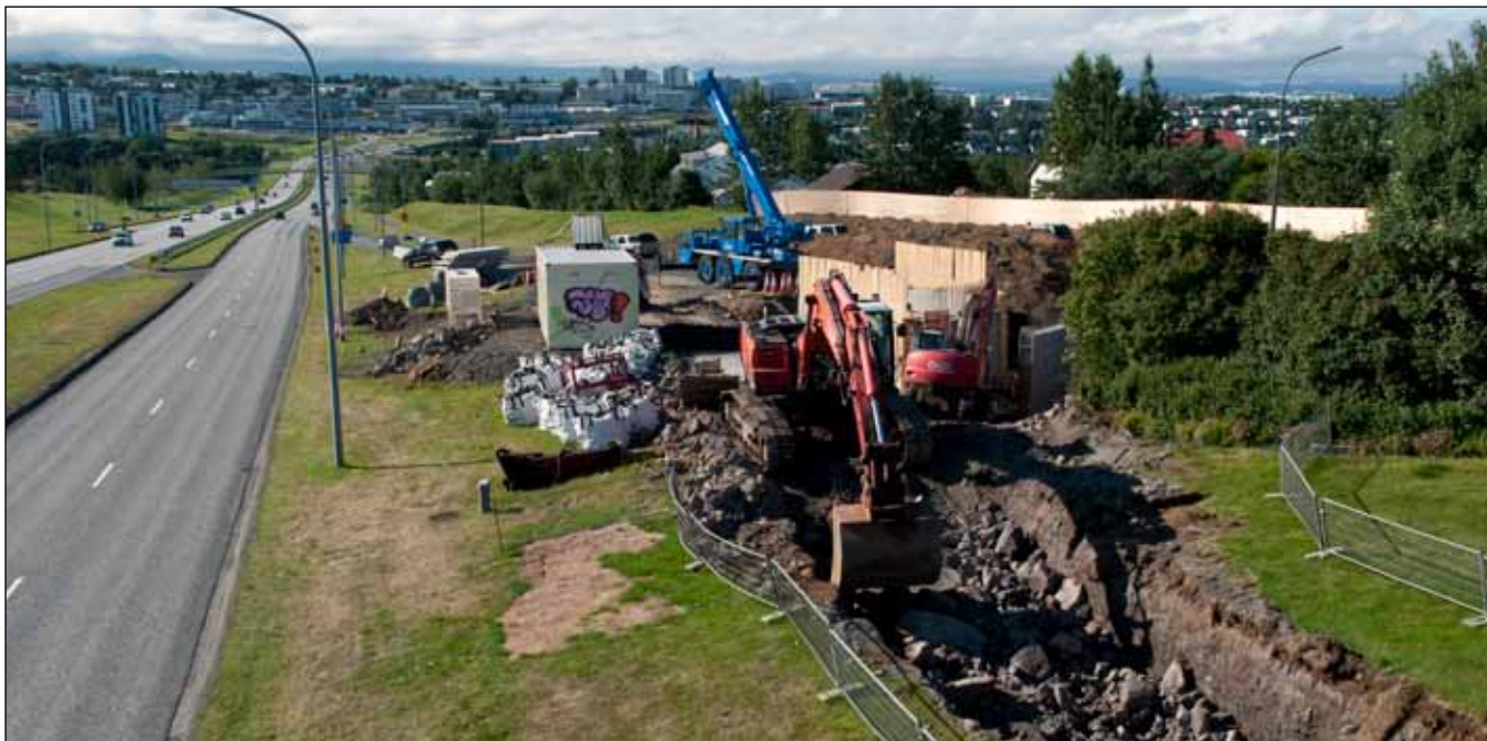
Framkvæmdir við undirgöng og rampa að Kringlumýrarbraut 4. ágúst 2010.