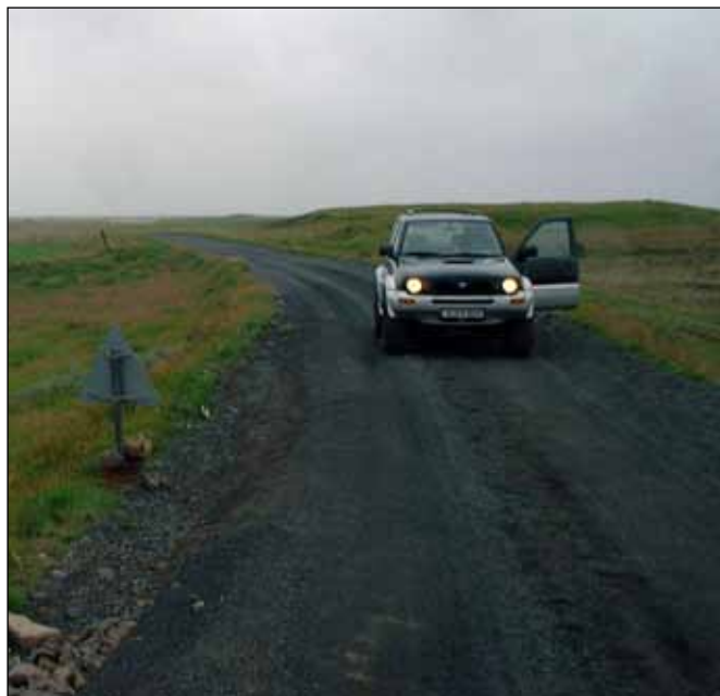
Ásvegur (275). Sjá útboðsauglýsingu hér til vinstri.