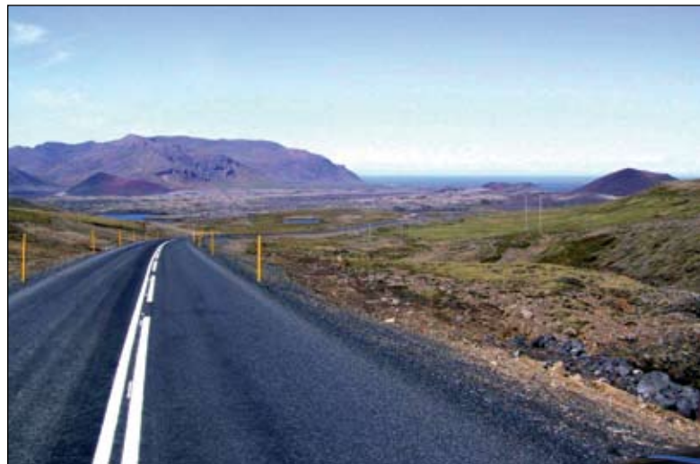
Viðurkenning Vegagerðarinnar fyrir gerð og frágang mannvirkja, tímabilið 1999-2001, Vatnaleið, verktaki Suðurverk hf.

Í árslok 2008 skal áætla- og umhverfiseild skila yfirstjórn skýrslu um framkvæmd verkefnisins það ár með tillögum um hvort og hvernig því verði haldið áfram á næstu árum.