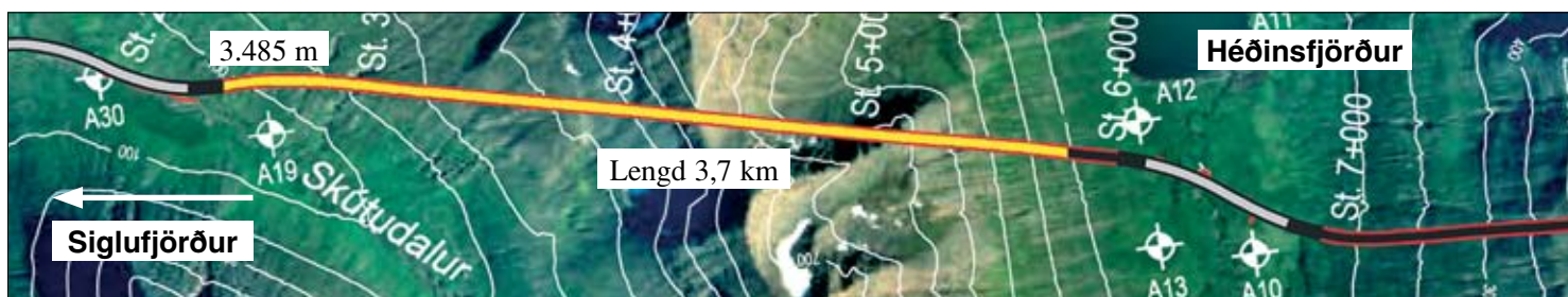
Staða framkvæmda við Héðinsfjarðargöng 3. mars. 2008. Búið er að sprengja 3.485 m í Siglufirði og 2.604 m í Ólafsfirði.

Samtals er því búið að sprengja 6.089 m eða um 57,6% af heildarlengd.