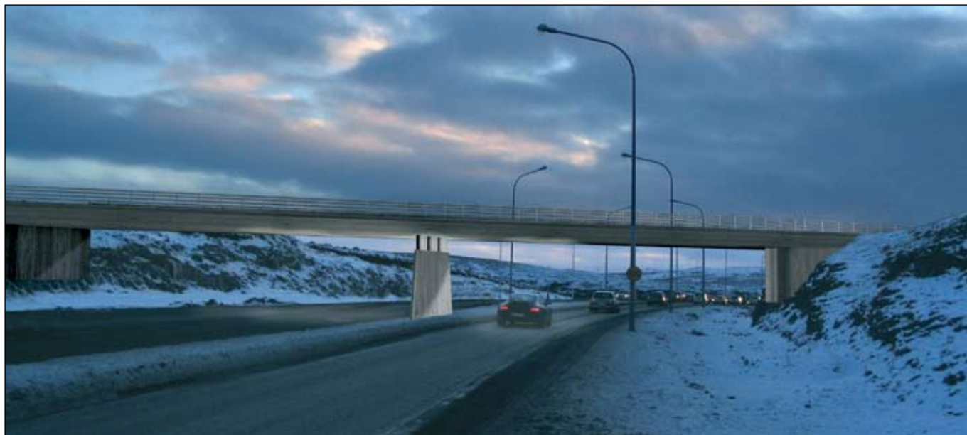
Hér á síðunni er auglýst útboð mismálgra gatnamóta Reykjanesbrautar og Vífilsstaðavegar. Í 5. tbl. var grein um þessi gatnamót og þá birtist mynd af útliti brúar í stórum dráttum á forsíðu. Hér er mynd sem sýnir endanlegt útlit.

Merking vinnusvæða. Bæklingur Vegagerðarinnar í samstarfi við lögreglu og Gatnamálastofu Reykjavíkurborgar (2004).