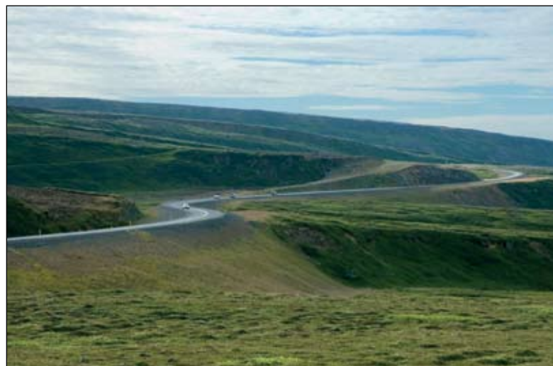
Viðurkenning Vegagerðarinnar fyrir gerð og frágang mannvirkja, tímabilið 2002-2004, Norðausturvegur á Tjörnesi, verktaki Ístak hf.