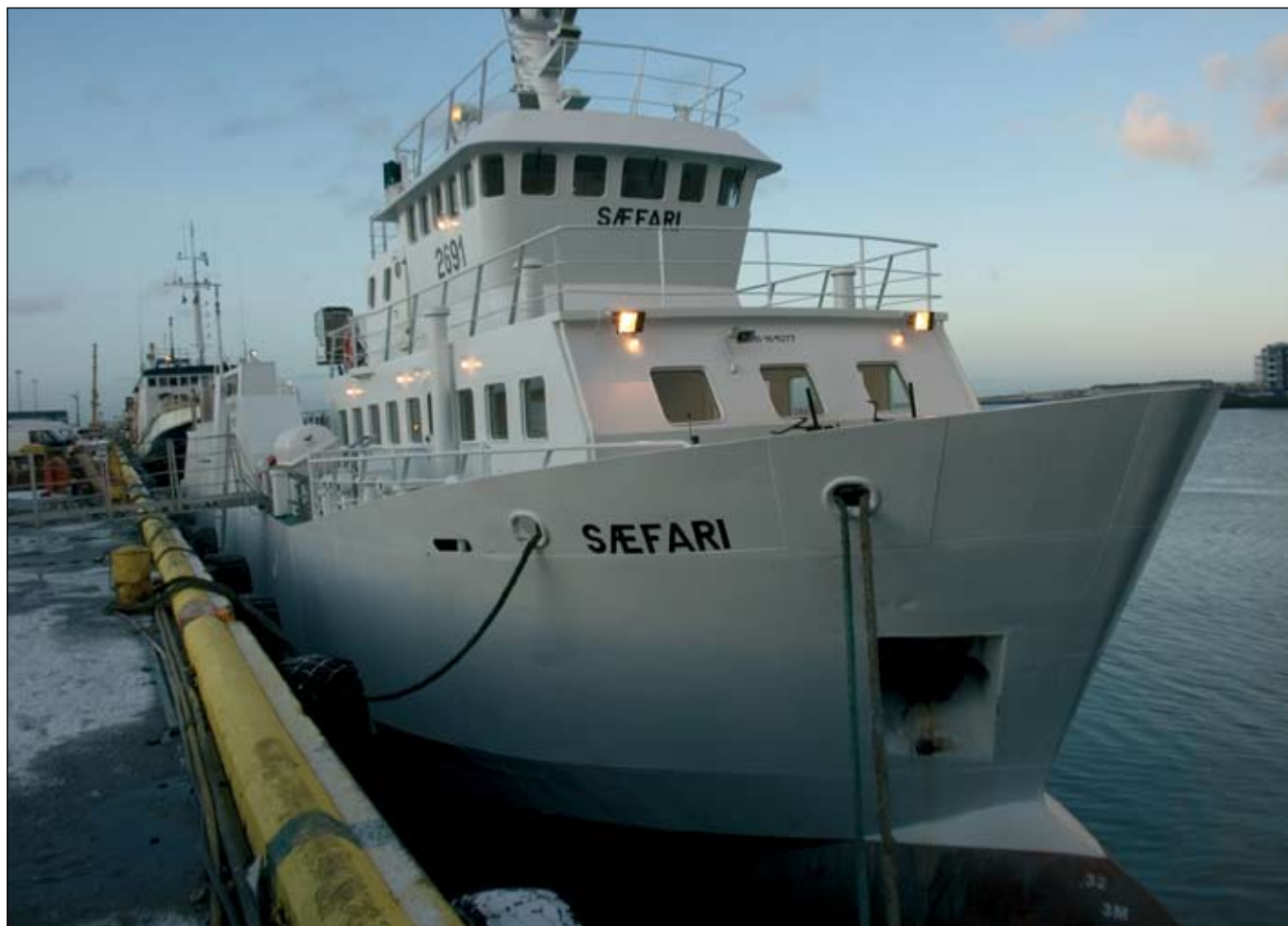
Grímseyjarferja í Hafnarfjarðarhöfn fyrir reynslusiglingu 13. desember 2007.

Þriðjudaginn 8. janúar var skrifað undir verksamning við Slippinn Akureyri. Reiknað er með að vinna hefjist á Akureyri 15. janúar og að skipinu verði siglt norður föstudaginn 11. janúar. Miðað er við að vinna verkið á þremur vikum. Fljótlega að því loknu ætti hinn nýi Sæfari að geta hafið reglulegar siglingar milli Grímseyjar og Dalvíkur.