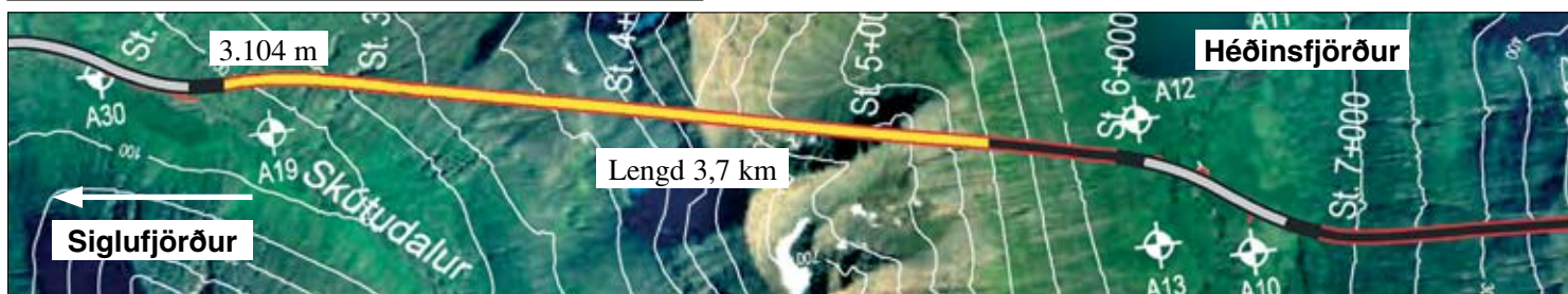
Staða framkvæmda við Héðinsfjarðargöng 19. des. 2007. Búið er að sprengja 3.104 m í Siglufirði og 2.139 m í Ólafsfirði.

Vinna við Héðinsfjarðargöng hófst á ný eftir jólahlé þann 7. janúar. Staðan á myndinni hér að neðan miðast við miðvikudaginn 19. desember þegar verktaki fór í jólafrí.