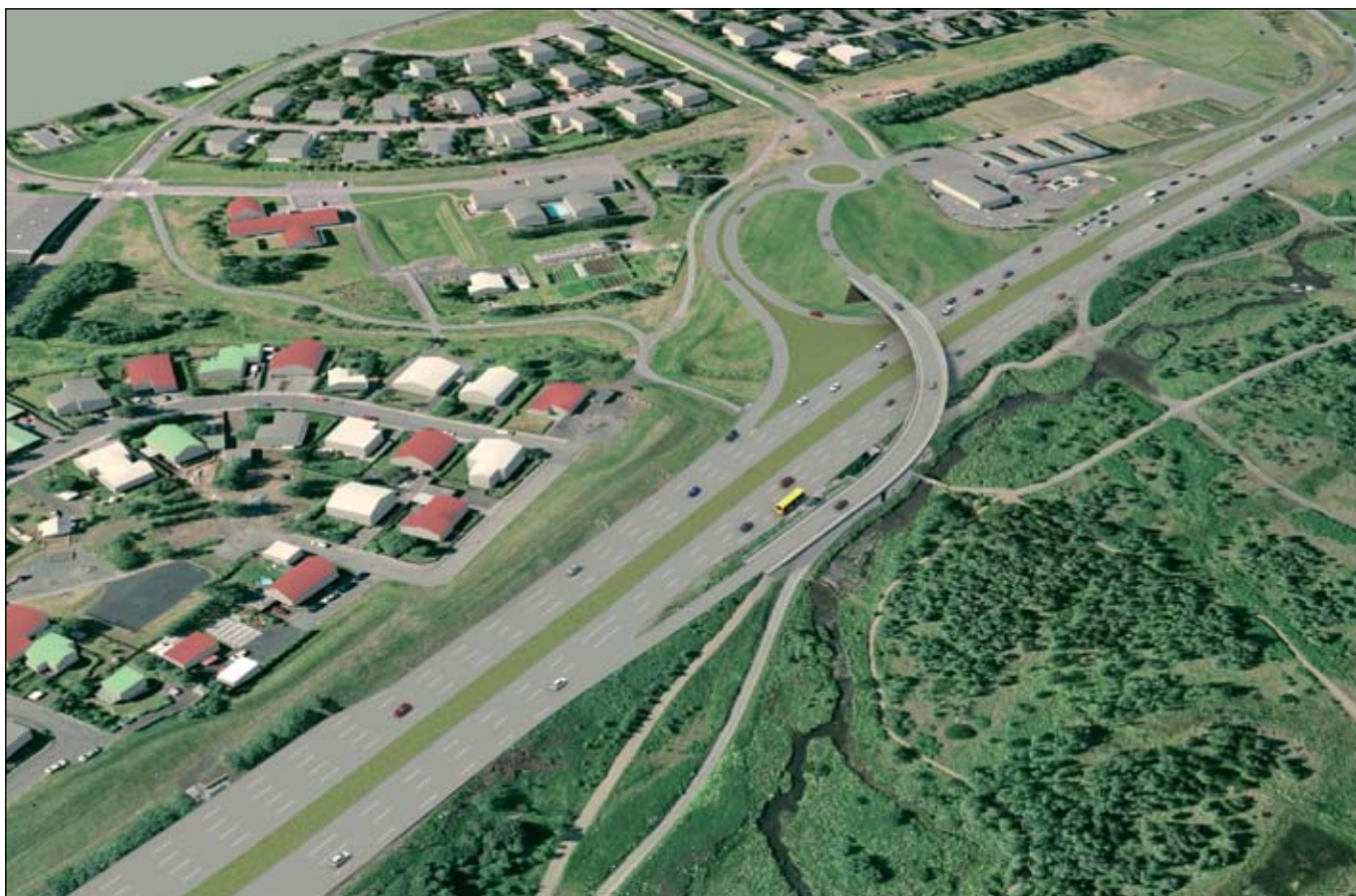
Breiðholtsbraut - Bústaðavegur. Möguleg mislæg gatnamót með brú. Mynd: Línuhönnun - Onno