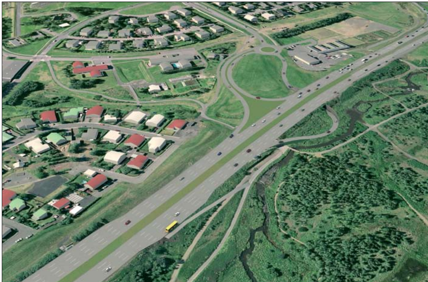
Breiðholtsbraut - Bústaðavegur. Möguleg mislæg gatnamót með undirgöngum.

G. Pétur Matthíasson, upplýsingafulltrúi Vegagerðarinnar