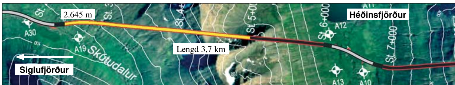
Staða framkvæmda við Héðinsfjarðargöng 29. okt. 2007. Búið er að sprengja 2.645 m í Siglufirði og 1.815 m í Ólafsfirði.