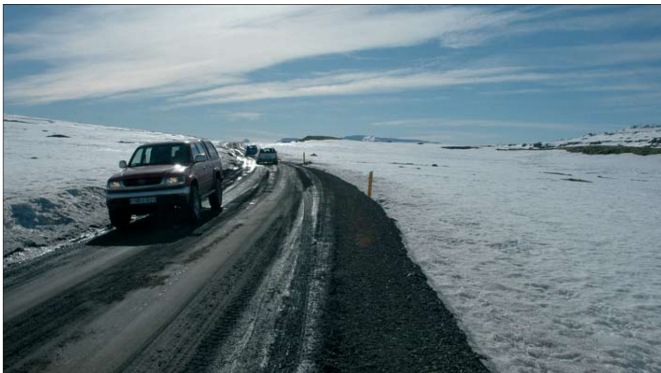
Nýr vegur um Öxi kemur inn sem flýtiverk í átaki ríkisstjórnarinnar..

Skila skal tilboðum á sömu stöðum fyrir kl. 14:00 þriðjudaginn 31. júlí 2007 og verða þau opnuð þar kl. 14:15 þann dag.