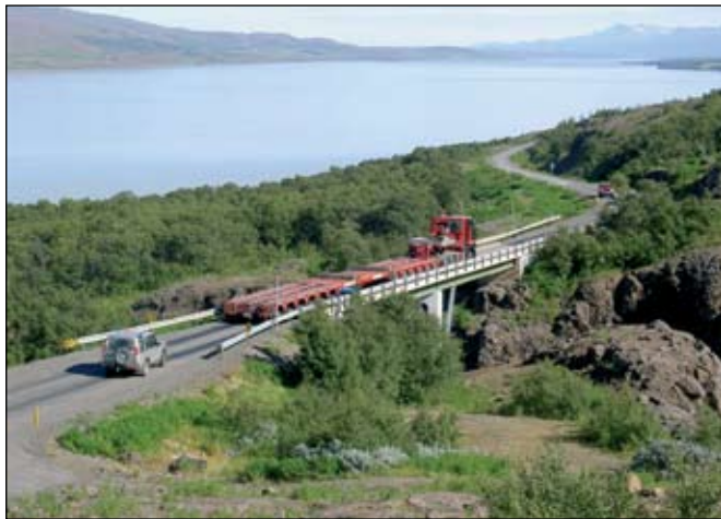
Tóm flutningslestin á leið yfir brú á Klifá.