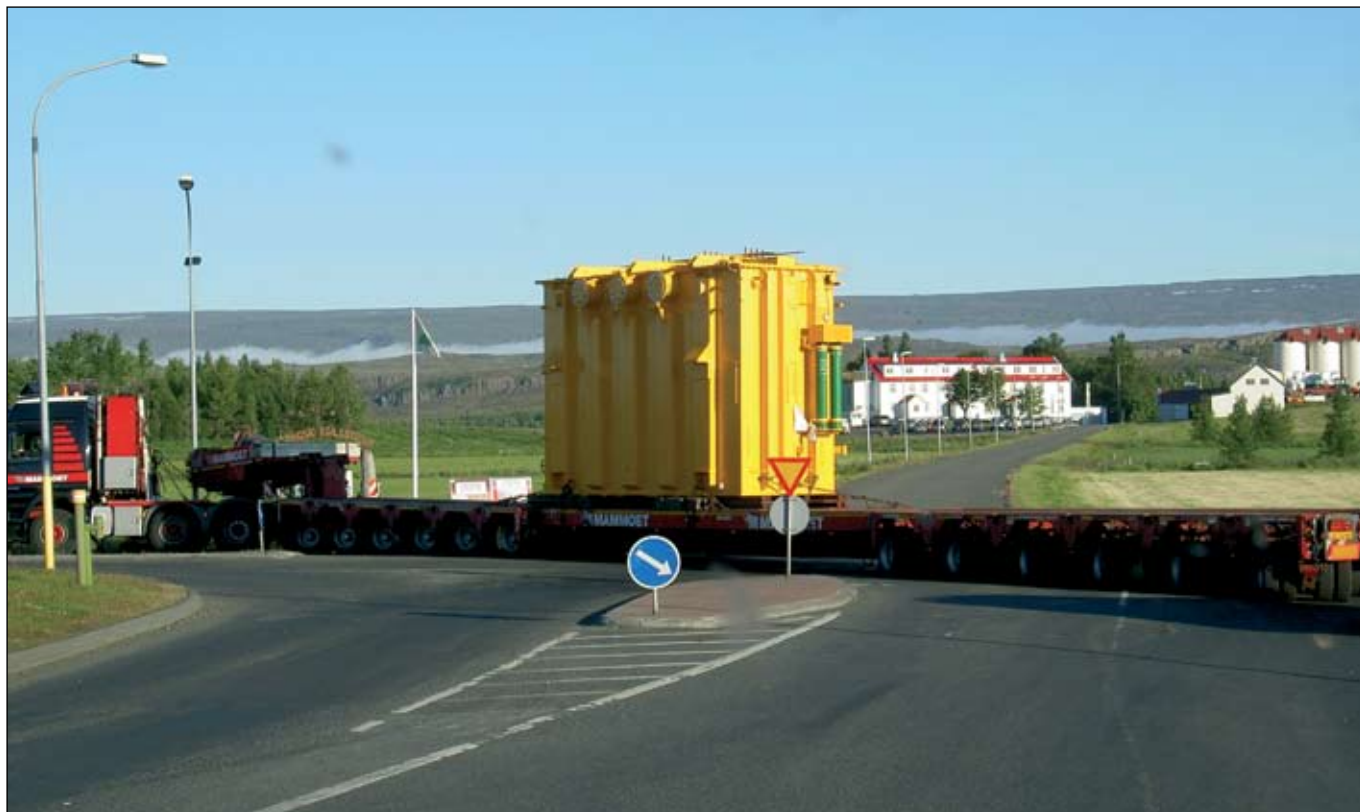
Mammoet vagnlestin beygir á öllum hjólum af Norðfjarðarvegi (92) inn á Hringveg (1) við Egilsstaði.