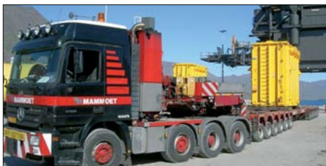
Dráttarbíll á hafnarbakka.