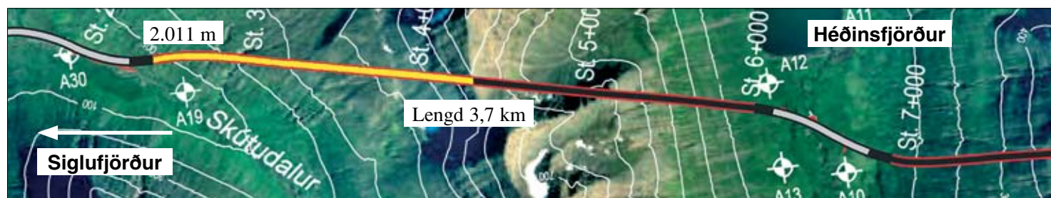
Staða framkvæmda við Héðinsfjarðargöng 9. júlí 2007. Búið er að sprengja 2.011 m í Siglufirði og 1.364 m í Ólafsfirði.