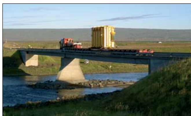
Á leið yfir Grímsá á Völlum.