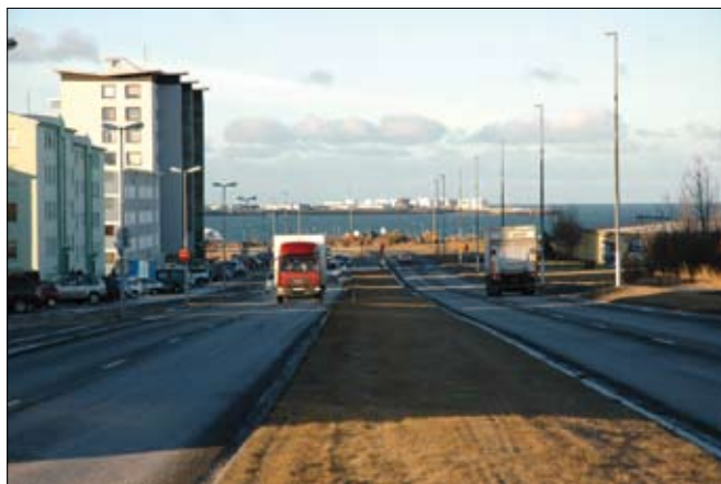
Núverandi Sæbraut. Byggðar verða tvær akreinar norðan við þessar. Syðri akreinar verður þá Kleppsvegur og hljóðveggur rís á umferðareyju þar á milli.

Verkið verður unnið í fjórum skilgreindum áföngum og á að vera að fullu lokið í október 2006.