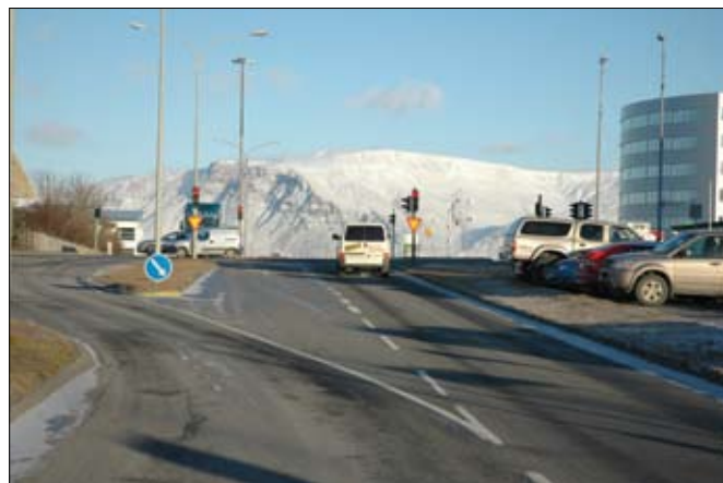
Gatnamót Dalbrautar og Sæbrautar.