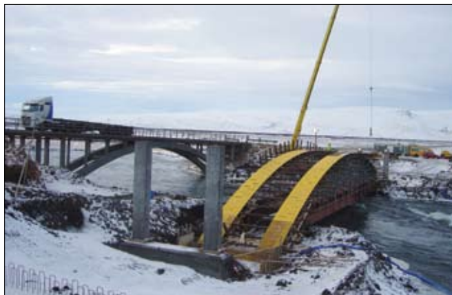
Brúavinnuflokkur Vegagerðarinnar frá Hvammstanga byggir nú nýja brú á Laxá hjá Laxamýri. Myndina tók Vigfús Sigurðsson 18. nóvember sl.