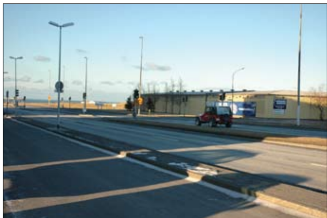
Vegna tengingar Klettagarða við Sæbraut þarf að rífa hluta þessara bygginga.