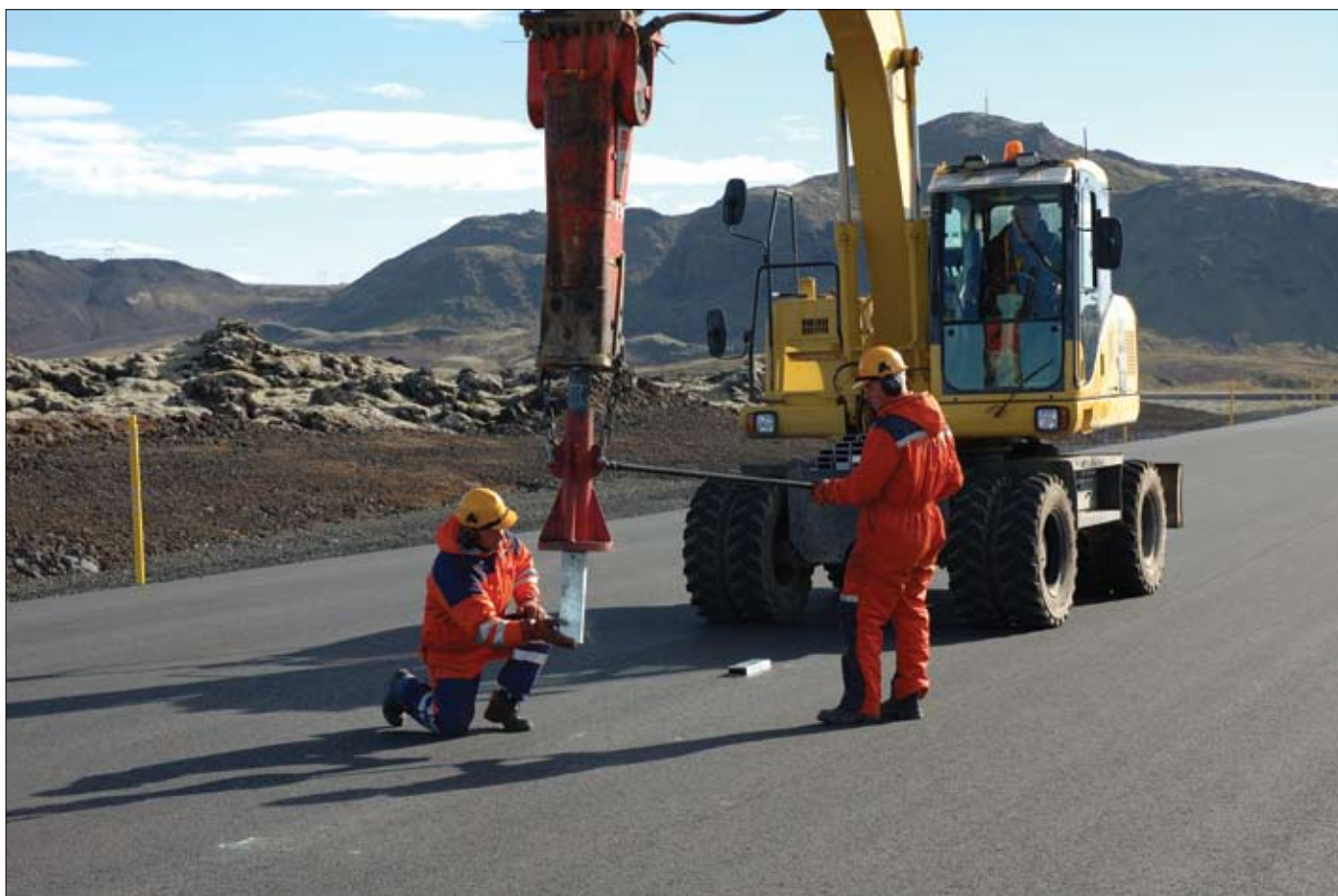
Nú er unnið að uppsetningu á miðjuvegríði á nýjum kafla Hringvegarins um Svínahraun. Þar verður fullbúinn 2+1 vegur reyndur í fyrsta sinn á Íslandi. Nánar verður fjallað um þessa framkvæmd síðar hér í blaðinu.