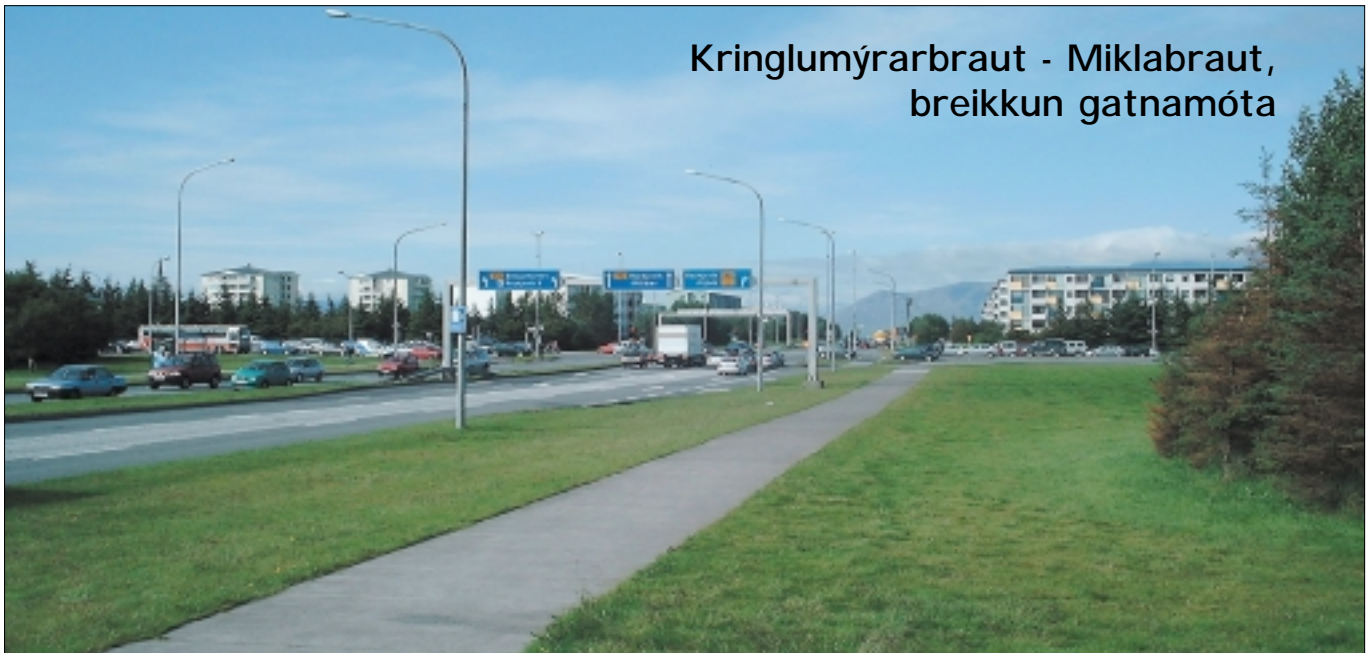
Kringlumýrarbraut - Miklabraut, breikkun gatnamóta