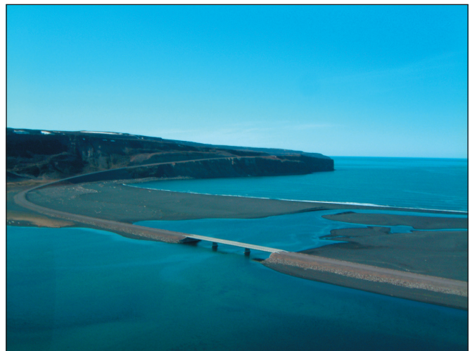
Ný 100 m löng brú á Lónsós í Öxarfirði. Verktaki var Vík ehf. á Húsavík. Í baksýn má sjá nýjan veg upp á Tjörn en þar var Ístak hf. verktaki.