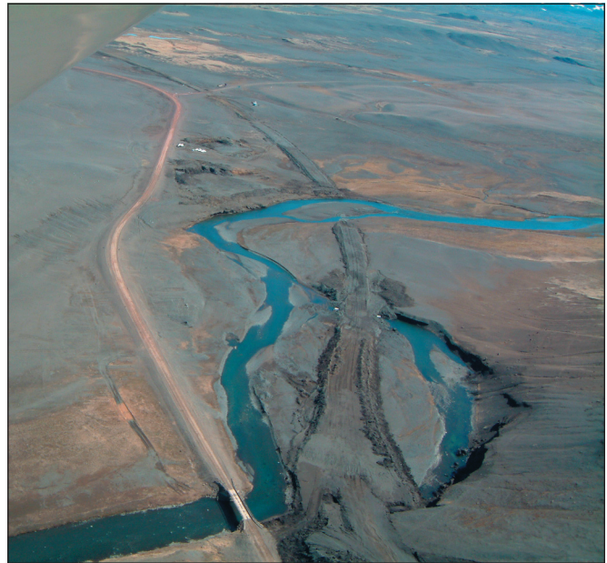
Hringvegur (1), Vegaskarð - Langidalur. Ný- og endurbygging 12 km. Stálhólkur verður settur í Skarðsá. Horft í austur. Sjá má veg í Möðrudal ofarlega fyrir miðju. Verktaki er Héraðsverk ehf. Verki verður að fullu lokið í ágúst 2005.