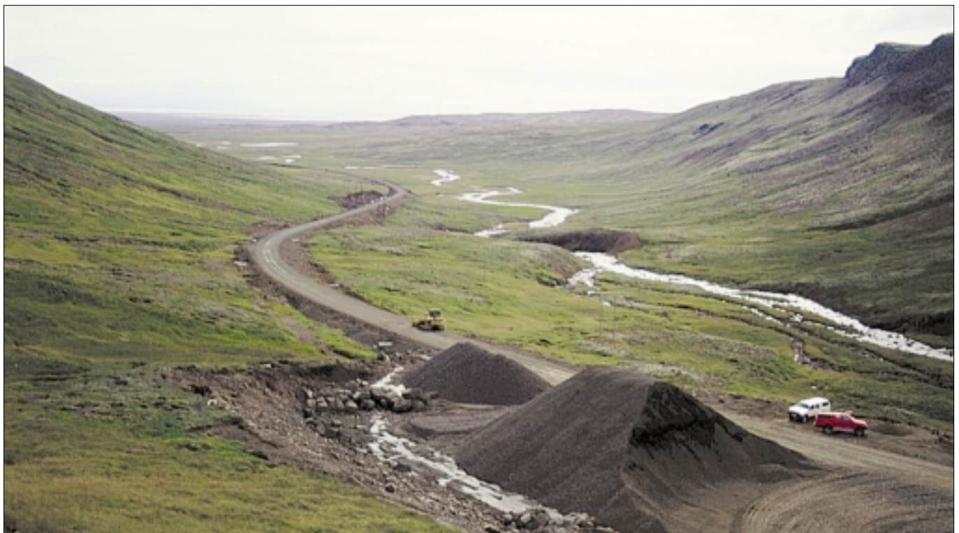
Vatnaleið. Framkvæmdir í ágúst 2001. Verktaki Suðurverk hf.