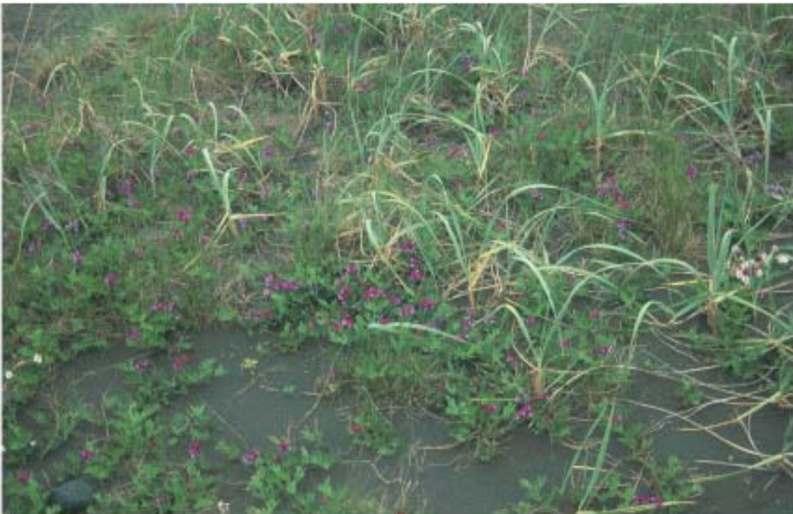
2. mynd. Á stöku stað, þar sem lítil hreyfing er á sandi, hefur baunagrass ( Lathyrus japonicus ) náð að festa rætur.