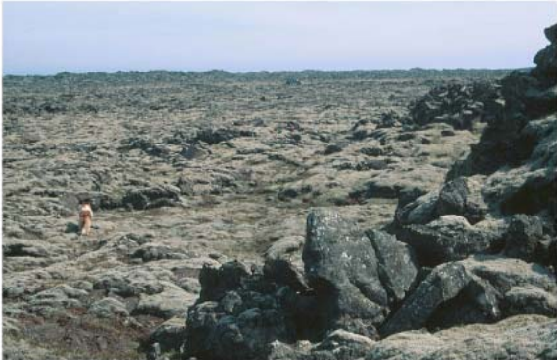
5. Mosapembur þekja stærstan hluta hrauna. Í lægðum vex einkum krækilyng og grasvíðir.