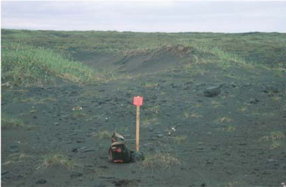
1. mynd. Myndin sýnir gróður í melhólum við mælistiku 48900.