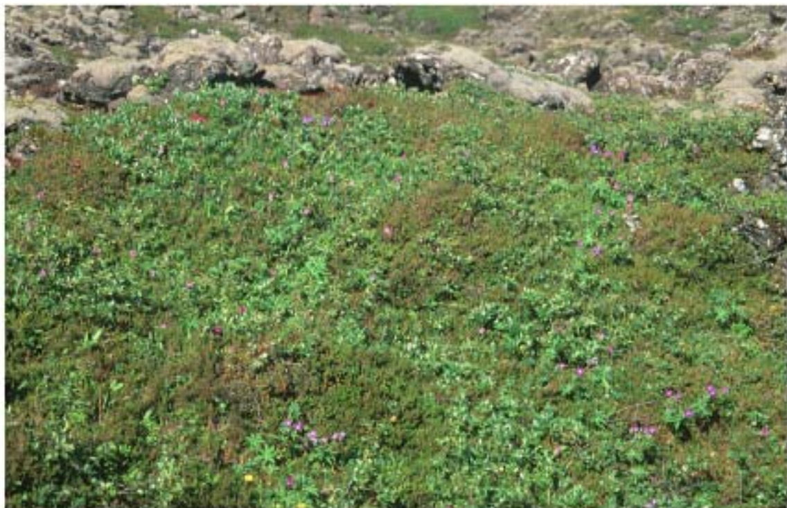
4. Í Krýsuvíkurhrauni hefur mosapemba víða breytt í tegundaríkt mólendi.