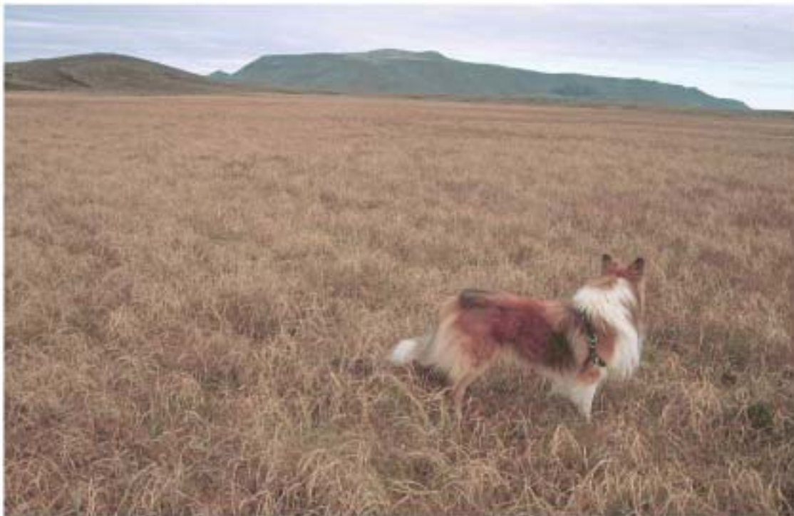
6. Trygghólamýri var áður gott slægjuland. Umhverfis hana er nú allt land blásið og hún er umlukt rofi á allar hliðar.