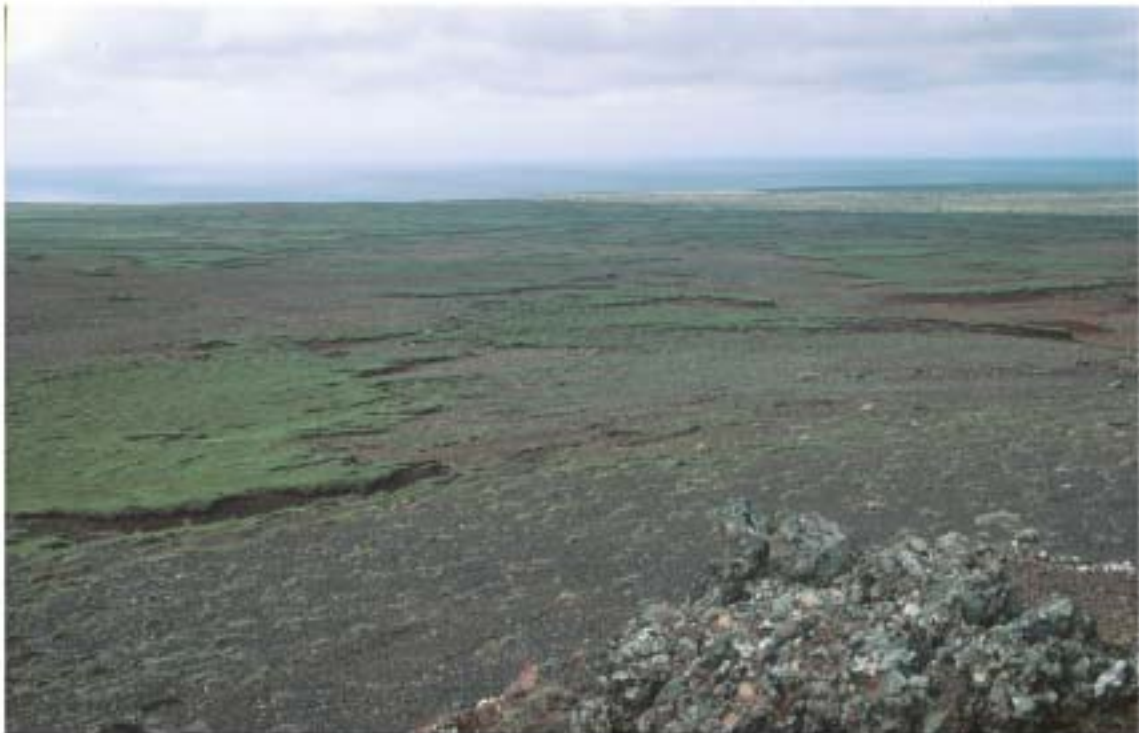
3. mynd. Séð yfir Krýsuvíkurheiði frá Borgahólum í átt að Ögmundarhrauni. Land er stórskemmt af völdum beitar.