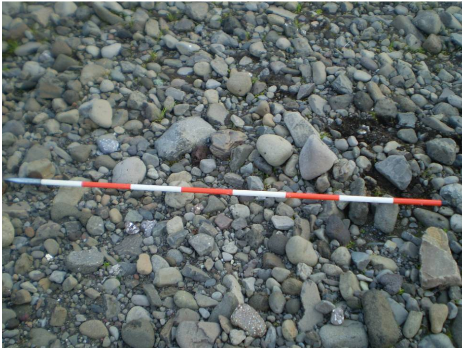
Mynd 2 Dæmigerð kornadreifing ármalar Norðfjarðarár.