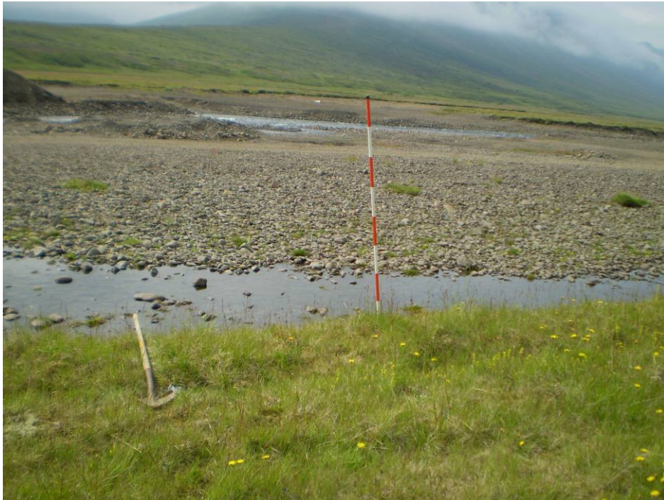
Mynd 3 Eyrar neðan við Kirkjuból