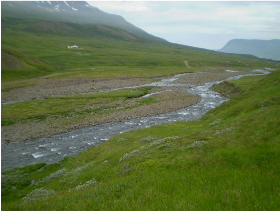
Mynd 1 Horft yfir fyrirhugað námasvæði við Hóla af suðurbakka Norðfjarðarár.