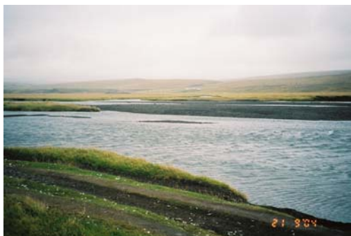
Mynd 3. Mynd af áætluðu brúarstæði við syðri veglínu.