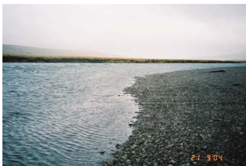
Mynd 4. Maríubakki í Hrútafjarðará