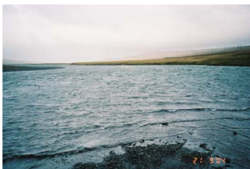
Mynd 5. Dumbafljót

Maríubakkinn er mjög langur hylur og án efa stærsti hylur Hrútafjarðarár (Sverrir Hermansson 2004). Á þessu svæði er malarbotn ríkjandi botnefni og straumur er orðinn mjög hægur í ánni. Sömu eiginleikar eiga við um Dumbafljótið þar sem áin breiðir vel úr sér og gætir þar flóðs og fjöru. Lax og bleikja veiðast á báðum stöðum, en þessir tveir neðstu staðir árinna eru einkum þekktir fyrir mjög góða bleikjuveiði, en sjóbleikjan ræður ríkjum á þessu svæði árinna.