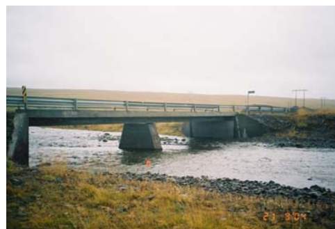
Mynd 2. Núverandi brú yfir Selá

Þær tillögur sem liggja fyrir af áætluðum brúarstæðum yfir Hrútafjarðará, gera annars vegar ráð fyrir að farið verði yfir Hrútu rétt neðan við ármót Selár og Hrútu (mynd 3), rétt ofan við veiðistað er nefnist Maríubakki (mynd 4).