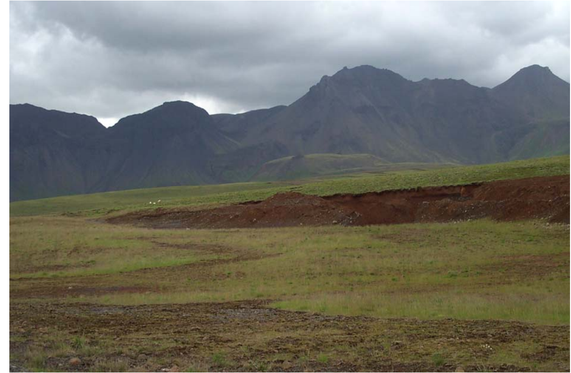
Mynd 15 Fjöllin sem afmarka miðhluta landslags í norðri. Mynd tekin frá núverandi vegi með námu D í forgrunni.