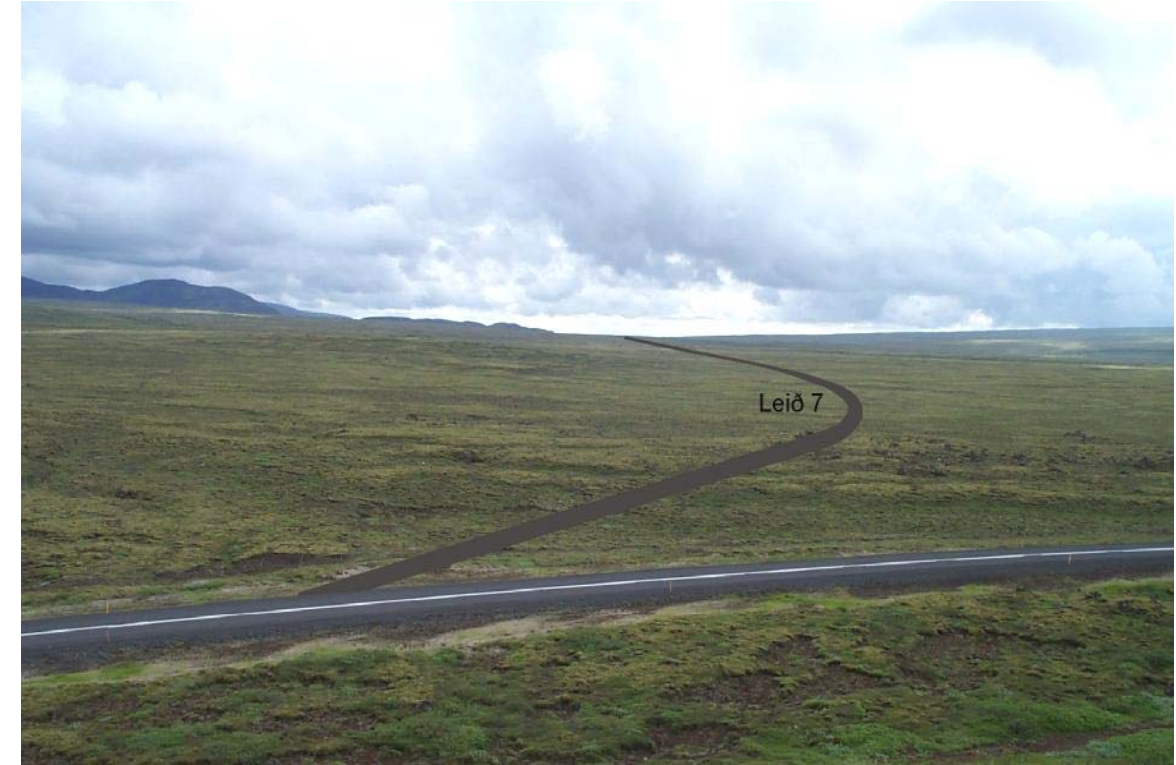
Mynd 19 Horft frá Miðfelli yfir leið 7. Teikningin á að gefa hugmynd um ásýnd leiðarinnar í landslagi en er ekki nákvæm.