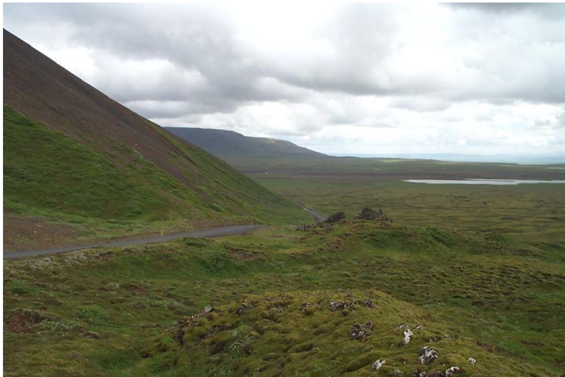
Mynd 8 Núverandi Gjábackkavegur í Barmaskarði. Horft til austurs, sést í vötnin á Beitivöllum.