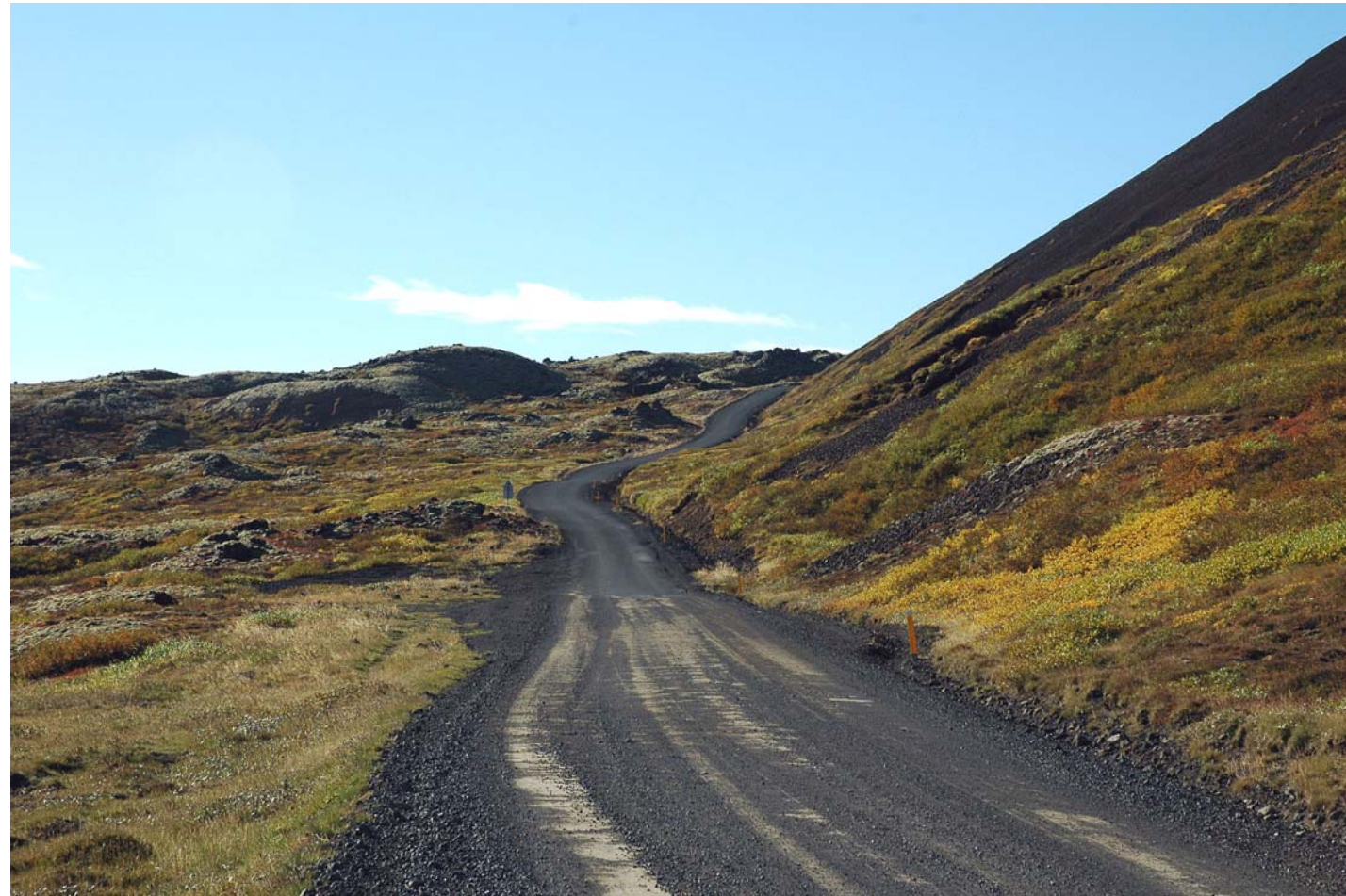
Mynd 25a Horft til vesturs upp Barmaskarðið. Fyrir framkvæmd