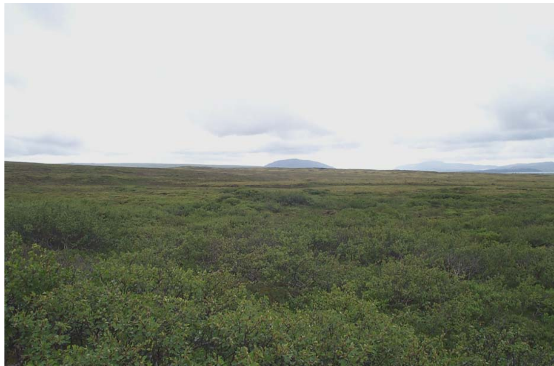
Mynd 4 Kjarri vaxið hraun í vestari landslagsheild. Horft til suðurs frá núverandi vegi, á myndinni sést hvernig slétt mosavaxið hraun tekur við af kjarrinu.