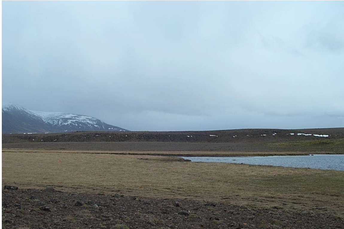
Mynd 10 Horft austur yfir Beitivelli að vori til. Hryggur í bakgrunni þar sem áætlað er að staðsetja námu B.