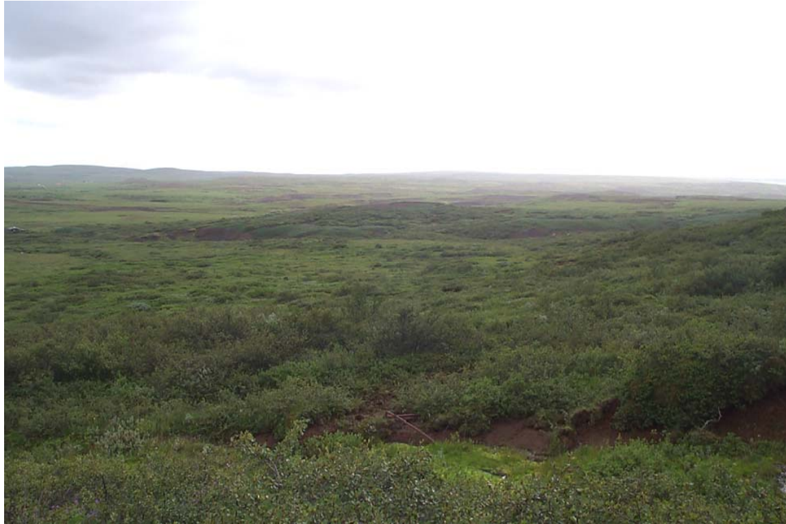
Mynd 18 Horft til suðurs yfir þétt birkikjarr í hlíðum Laugarvatnsfjalls.