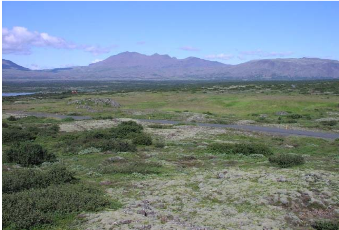
Mynd 2 Mannvistarlandslag í vestari landslagsheild. Bæjarstæði og önnur ummerki Gjábakka ofan vegar.