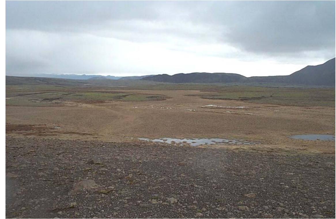
Mynd 11 Séð ofan á hluta af Blöndumýri að vori til, horft af Markahrygg til vesturs.