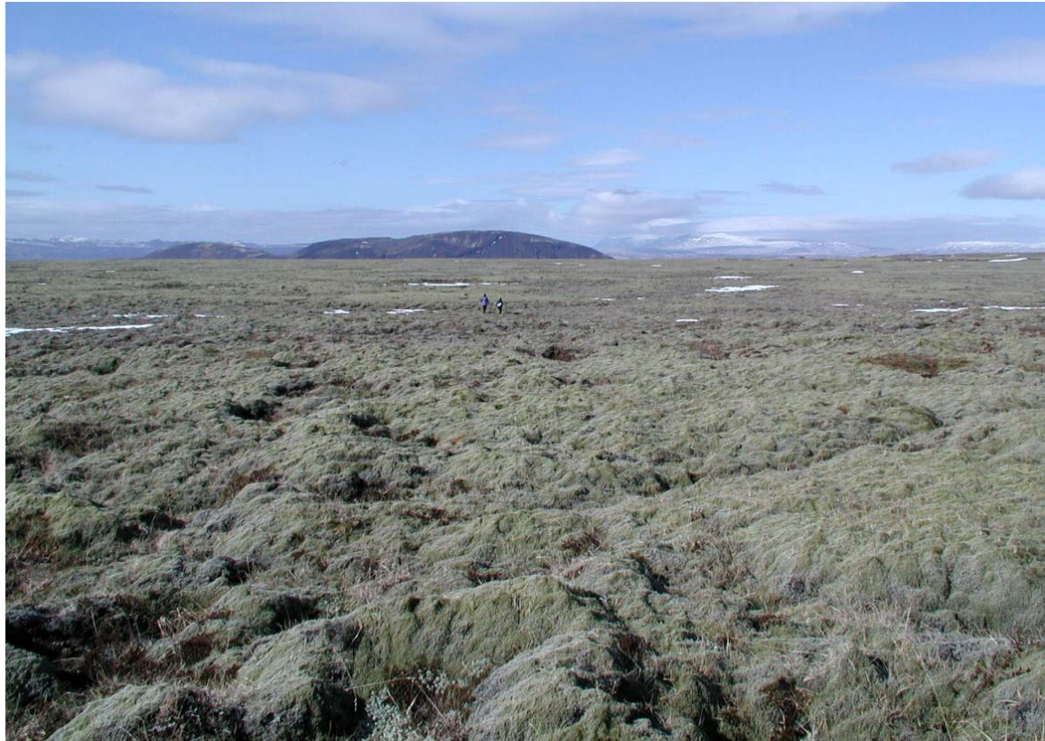
Mynd 23a Horft til vesturs yfir Eldborgahraun í landi Miðfells (Tekin við stöð 1.100 á leið 7). Miðfell í baksýn. Fyrir framkvæmd