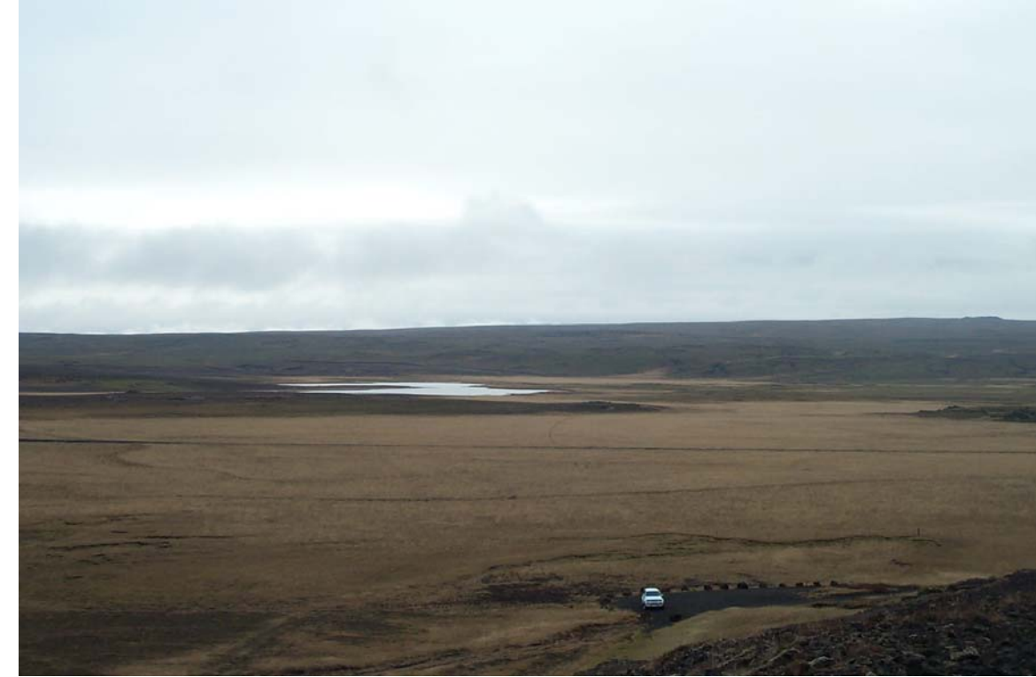
Mynd 22a Horft yfir Laugarvatnsvelli frá Laugarvatnshellum. Fyrir framkvæmd