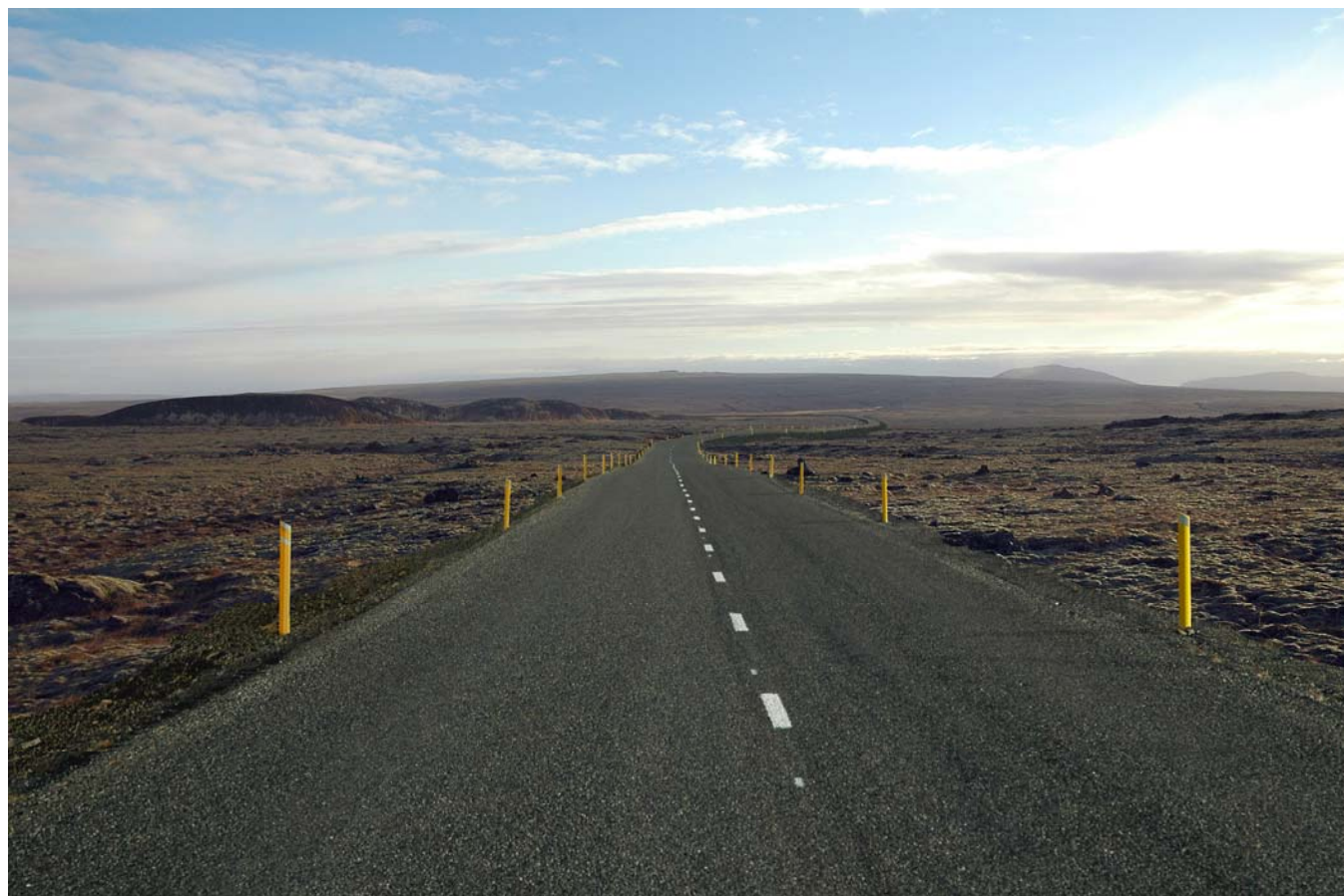
Mynd 32b Eldborgahraun, Litli-Reyðarbarmur og leið 3+1 – horft til suðurs. Eftir framkvæmd. Mynd tekin rétt sunnan við þar sem leið 3+1 sameinast leið 1