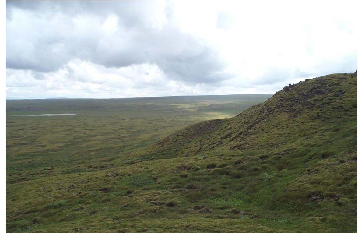
Mynd 7 Hraunið við Barmaskarð. Horft til suðausturs.