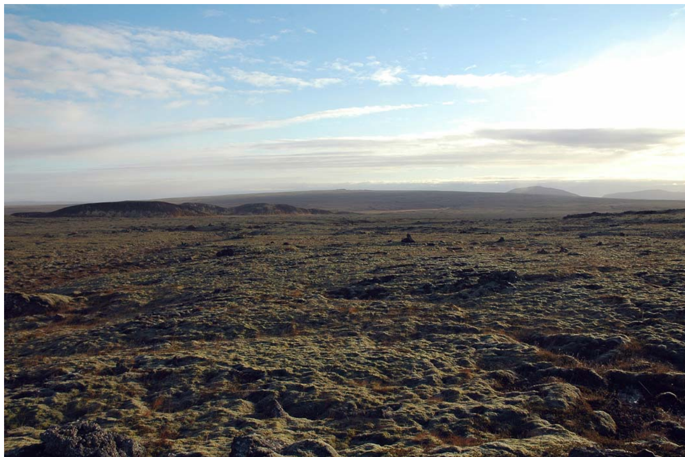
Mynd 32a Eldborgahraun og Litli-Reyðarbarmur – horft til suðurs. Fyrir framkvæmd