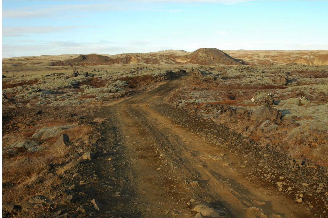
Mynd 30 Vegslóð vestan Litla-Reyðarbarmis í Eldborgahrauni