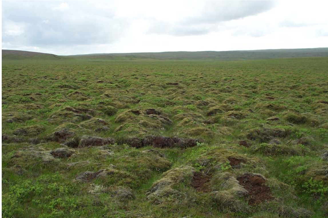
Mynd 14 Víðáttumikill mói tekur við austan megin við hrygginn á mynd 9. Horft í suðaustur frá núverandi vegi, ávalar brekkur Lyngdalsheiðar í baksýn.