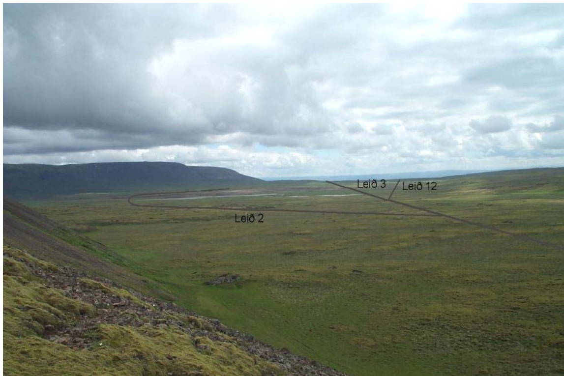
Mynd 20 Horft frá Litla-Reyðarbarmi til austurs. Teikningin á að gefa hugmynd um ásýnd leiða 2, 3 og 12a í landslagi en er ekki nákvæm.