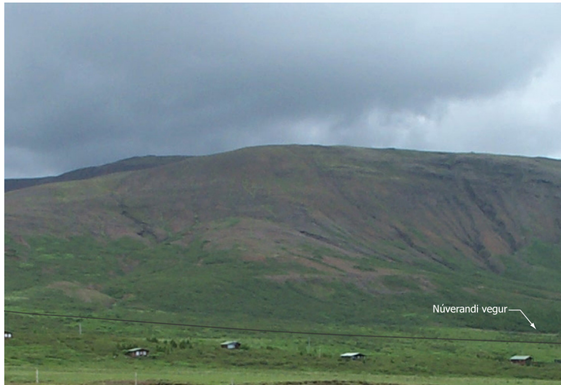
Mynd 21b Horft til norðurs yfir núverandi frístundabyggð í Eyvindartungu. Eftir framkvæmd (núverandi sumarhús eru 500 m frá vegi. Mynd tekin 800 m frá fyrirhuguðum vegi).