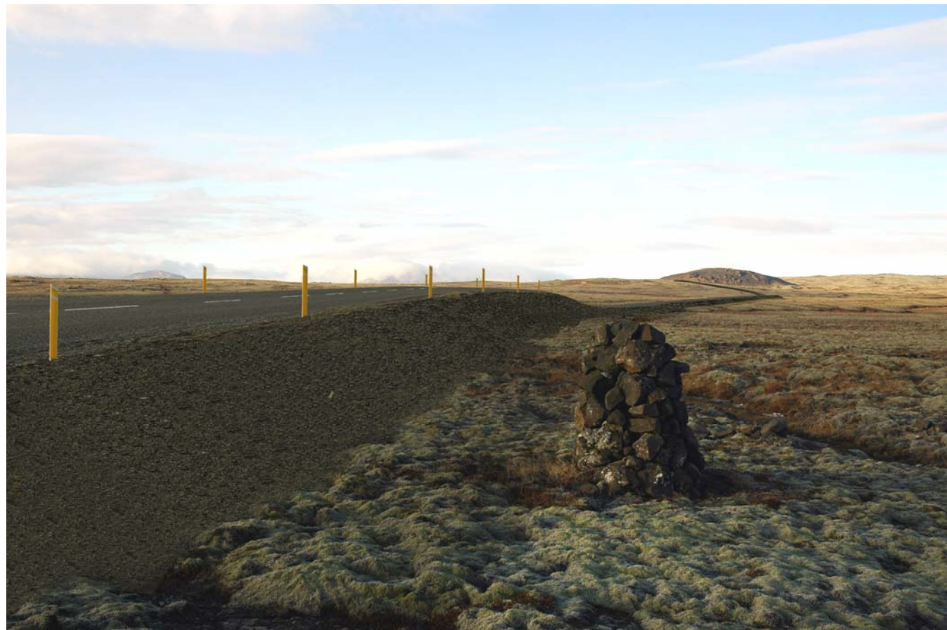
Mynd 31b Eldborgahraun, Stóra Dímon og leið 3+1. Horft til norðurs (stöð 2.500). Eftir framkvæmd