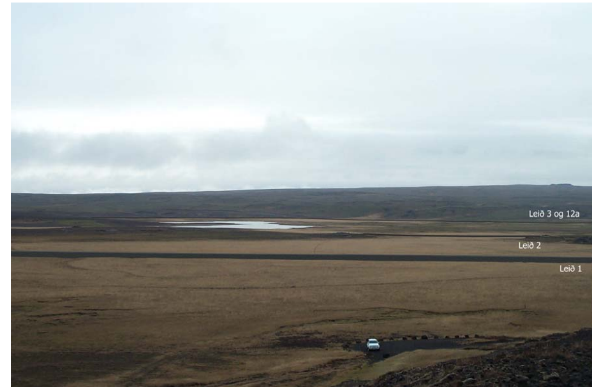
Mynd 22b Horft yfir Laugarvatnsvelli frá Laugarvatnshellum. Eftir framkvæmd (núverandi vegur er í um 220 m fjarlægð, leið 2 í 750 m fjarlægð og leiðir 3 og 12 í 1.800 m fjarlægð).