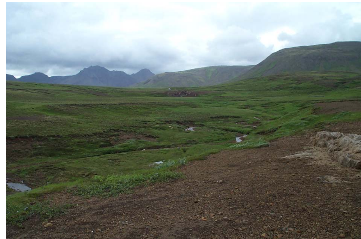
Mynd 17 Horft til norðvesturs í austari landslagsheild. Urðunarstaður ofarlega fyrir miðri mynd.