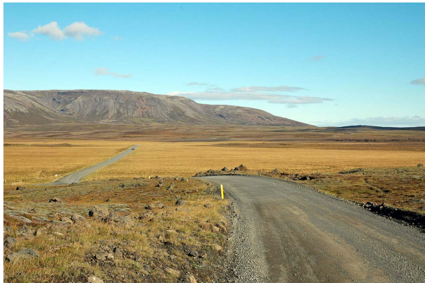
Mynd 26a Horft til austurs yfir Laugardalsvelli. Fyrir framkvæmd