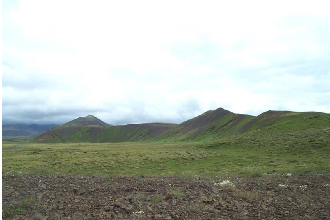
Mynd 6 Við suðurenda Litla-Reyðarbarms, horft í norður. Í forgrunni myndarinnar sést í námu sem staðsett er við enda fjallsins.