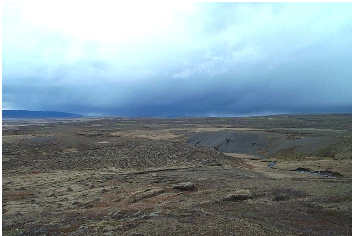
Mynd 16 Horft til suðurs yfir giljótt landslag austari landslagsheildar. Vísir að skógrækt fyrir miðri mynd.