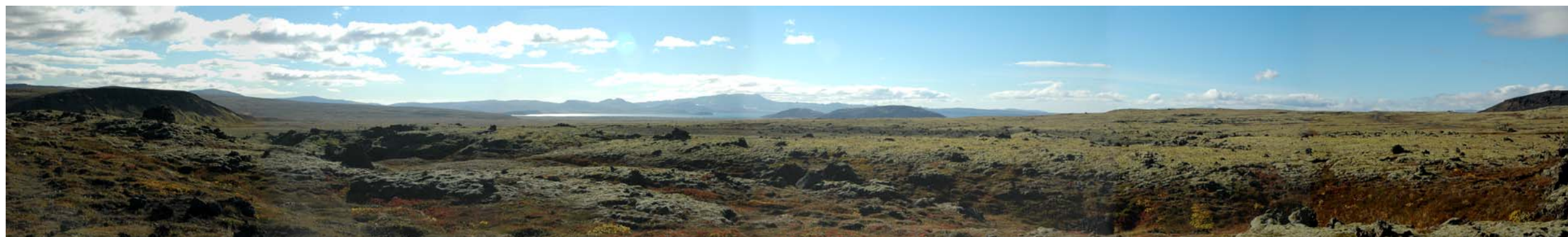
Mynd 27 Horft yfir Eldborgahraun – leið 3+1. Fyrir framkvæmd