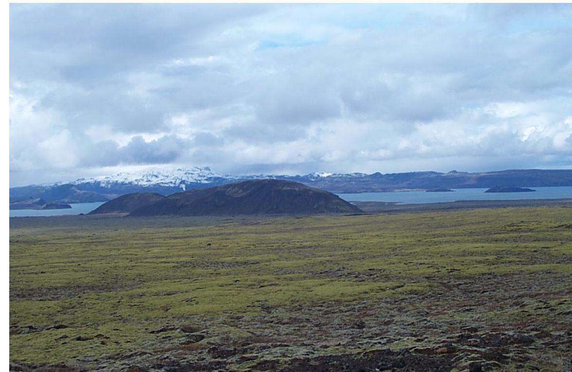
Mynd 9 Miðfell séð frá núverandi Gjábackkavegi, Pingvallavatn í baksýn. Horft til suðurs.