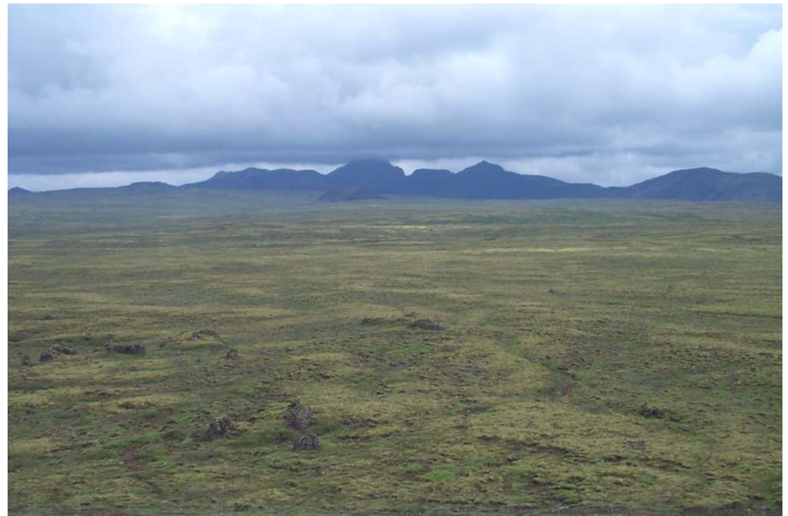
Mynd 5 Horft af Miðfelli yfir vestari landslagsheild. Reyðarbarmur lengst til hægri.