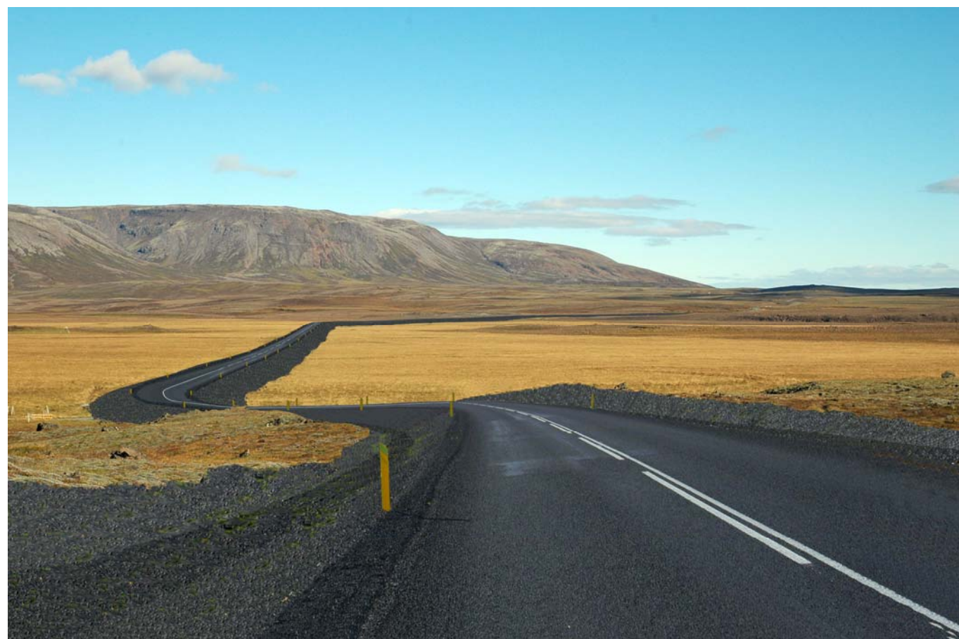
Mynd 26b Horft til austurs yfir Laugardalsvelli. Eftir byggingu leiðar 1