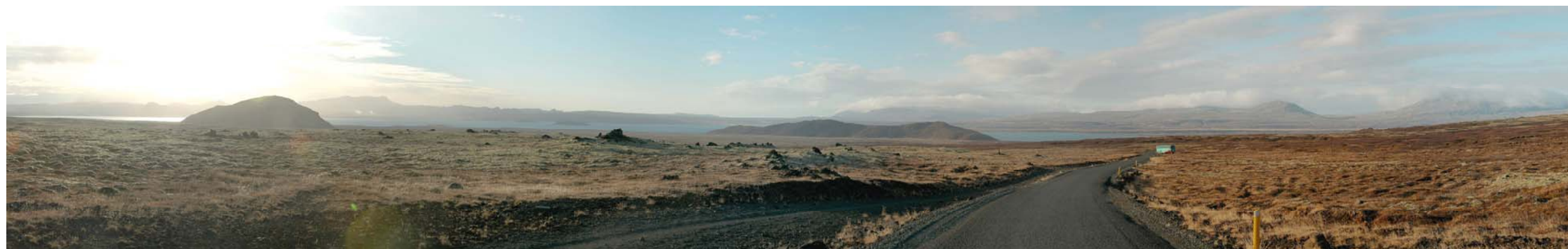
Mynd 28 Útsýni af núverandi vegi – horft til vesturs yfir Þingvallavatn (stöð ~13.200). Fyrir framkvæmd