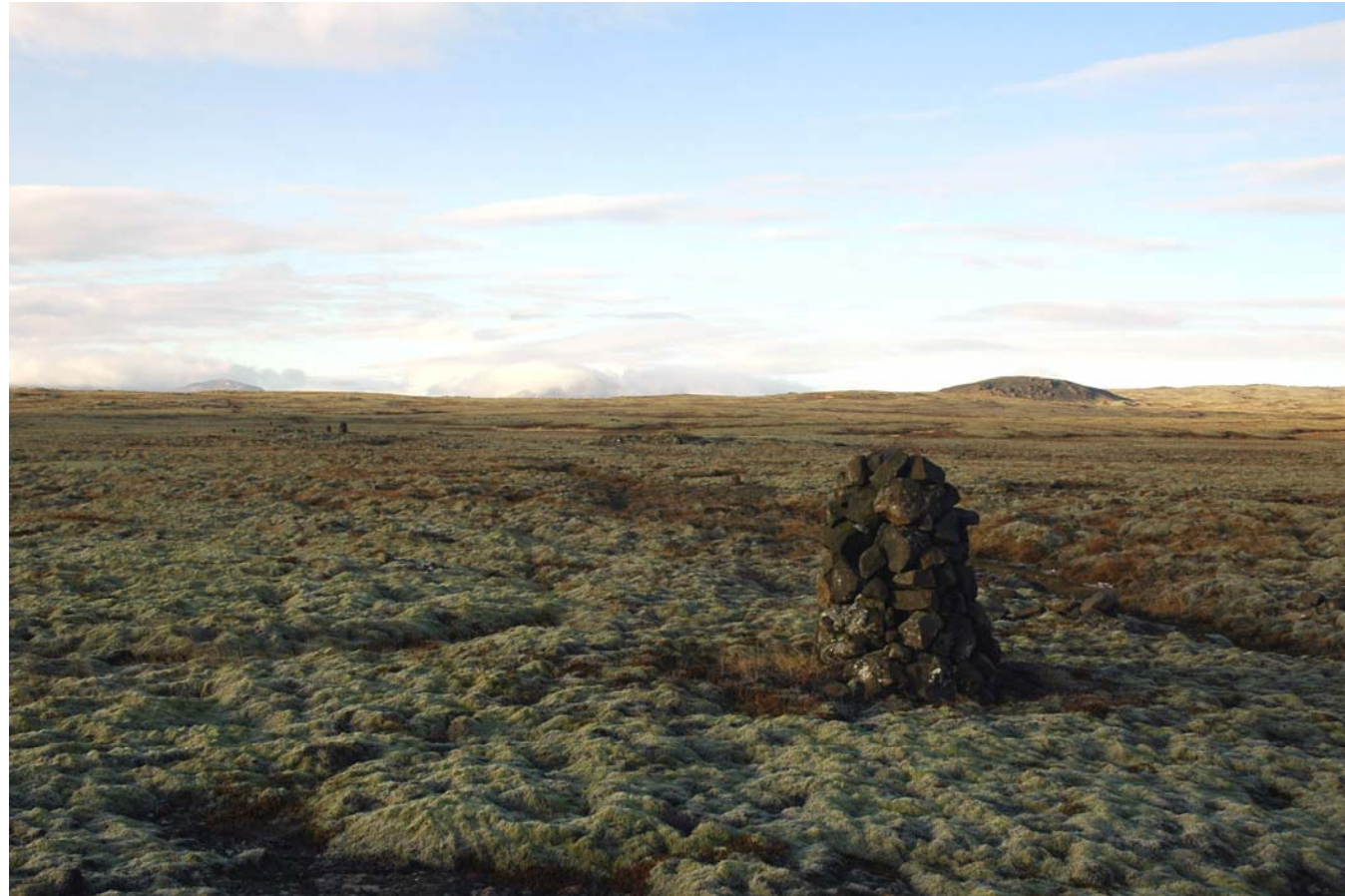
Mynd 31a Eldborgahraun og Stóra Dímon. Horft til norðurs - Fyrir framkvæmd