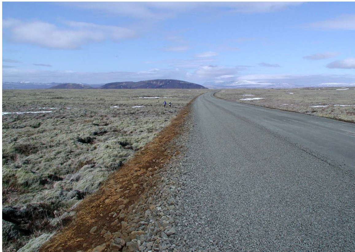
Mynd 23b Horft til vesturs frá stöð 1.100 á leið 7 í landi Miðfells. Fláar ófrágengnir. Eftir framkvæmd