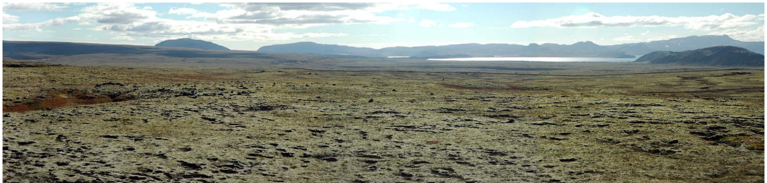
Mynd 24c Horft til suðurs yfir Eldborgahraun frá Tintron. Eftir byggingu leiðar 7