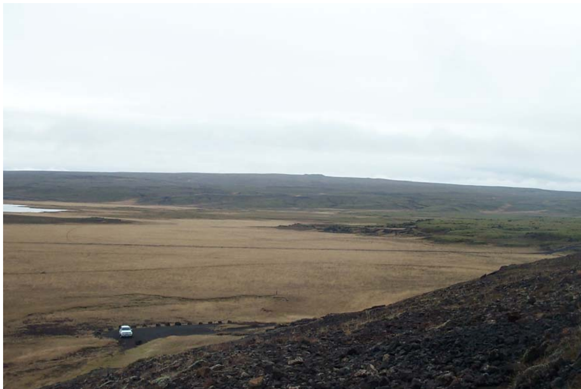
Mynd 12 Laugarvatnsvellir og Beitivellir um haust. Myndin er tekin frá Laugarvatnshellum, núverandi vegur sem strik fyrir miðri mynd. Lyngdalsheiði í baksýn.