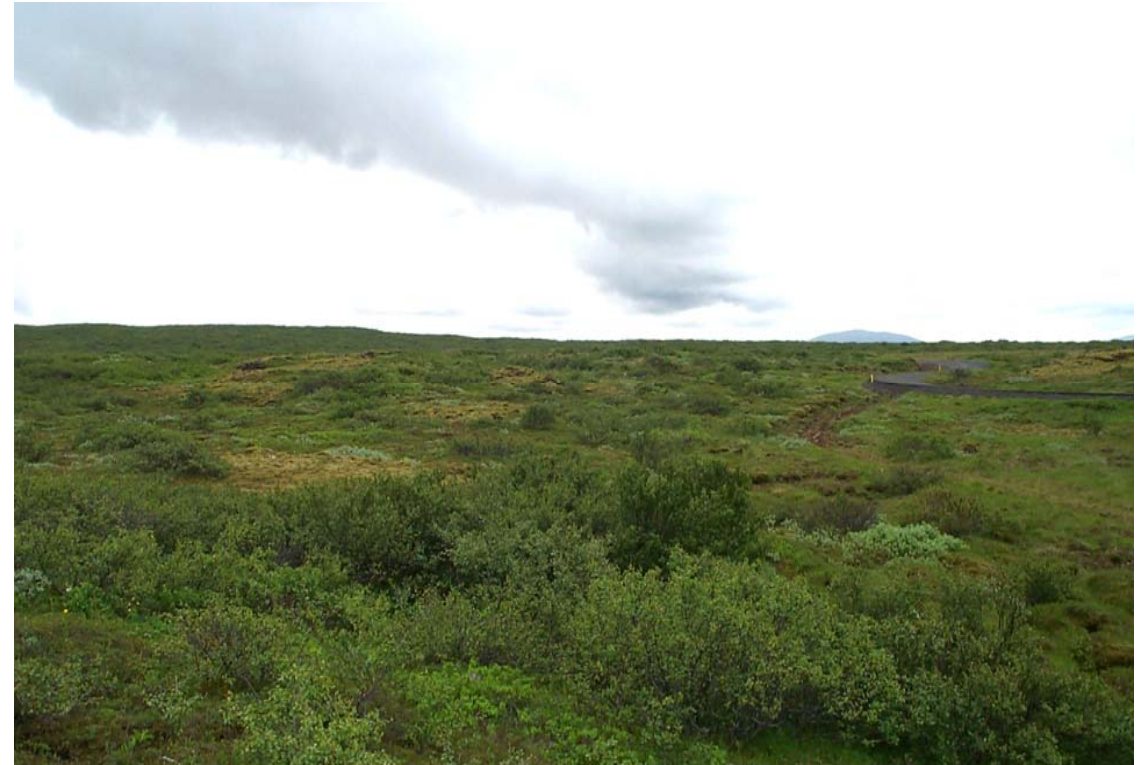
Mynd 3 Núverandi Gjábyggvegur í vestari landslagsheild. Horft til austurs og rétt sést í Kóngsveginn vinstra megin við veginn.