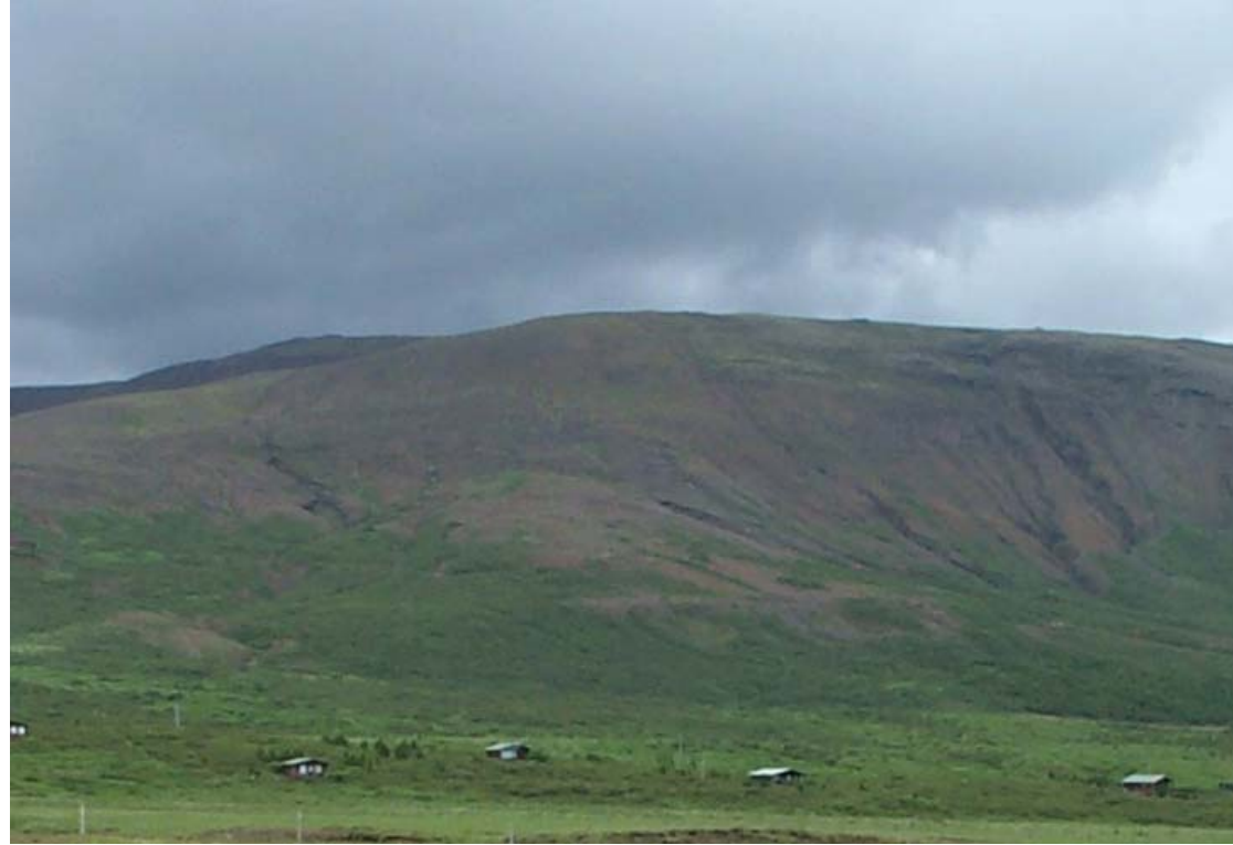
Mynd 21a Horft til norðurs yfir núverandi frístundabyggð í Eyvindartungu. Fyrir framkvæmd