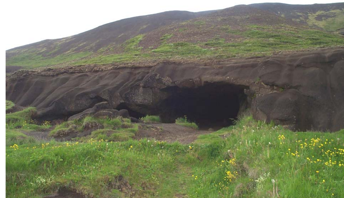
Mynd 13 Laugarvatnshellar á miðhluta framkvæmdarsvæðisins.