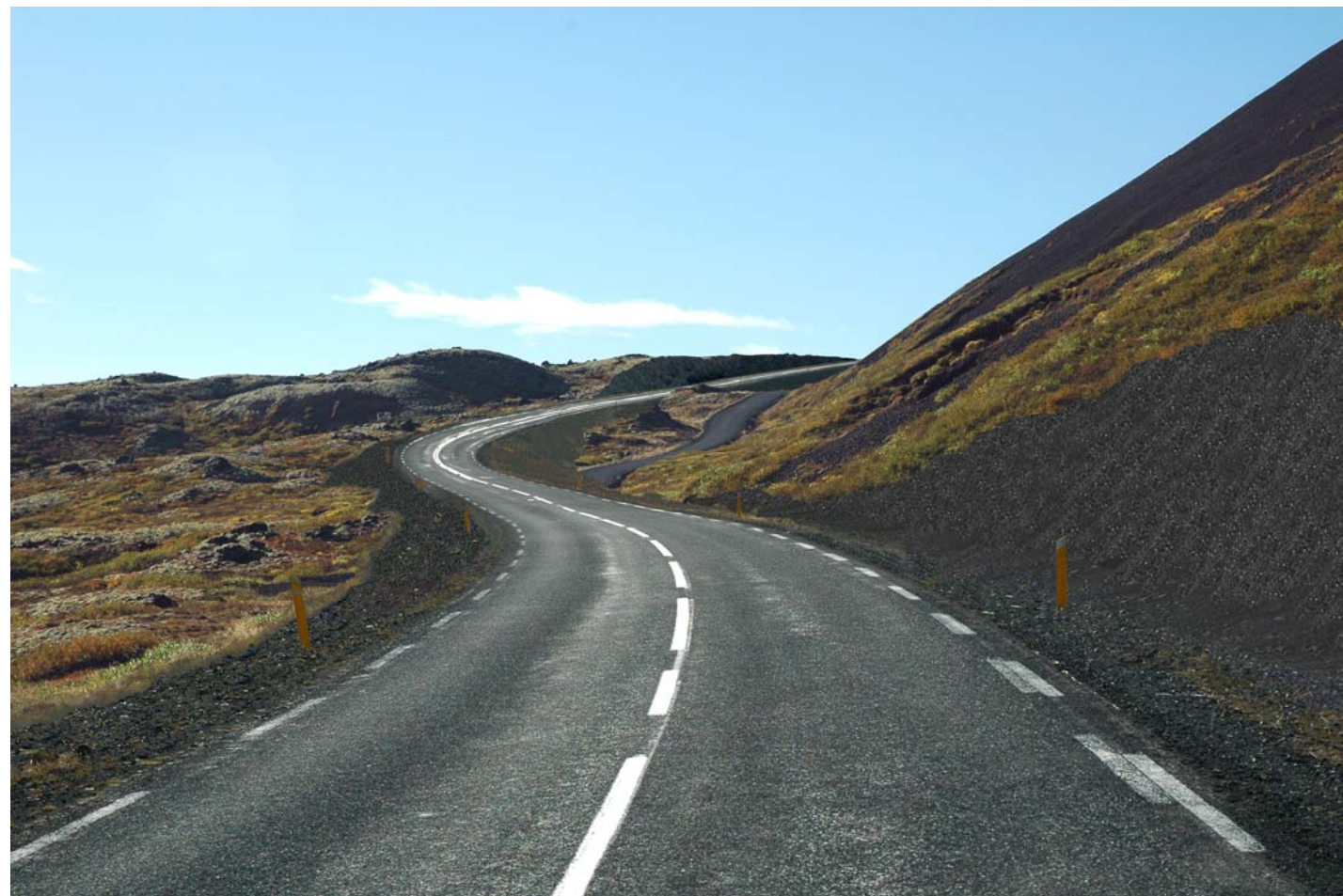
Mynd 25b Horft til vesturs upp Barmaskarðið. Eftir byggingu leiðar 1