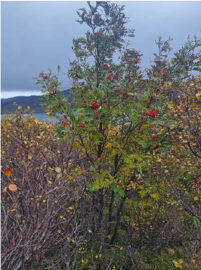
Mikið af berjum á reynitrjám

Hinsvegar var ágætis uppskera í reyniberjum frá Grímkelsstaðaá og út á Grenitrésnes. Samtals safnaðist um 15 líter af berjum, allt frá heilbrigðum og vöxtulegum trjám.