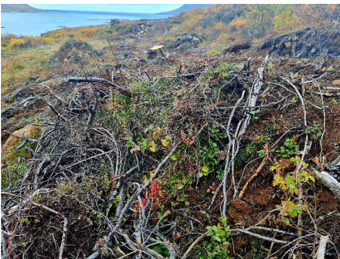
Rótarskot af birki og nokkuð frísklegur staðargróður í röskuðu svæði.