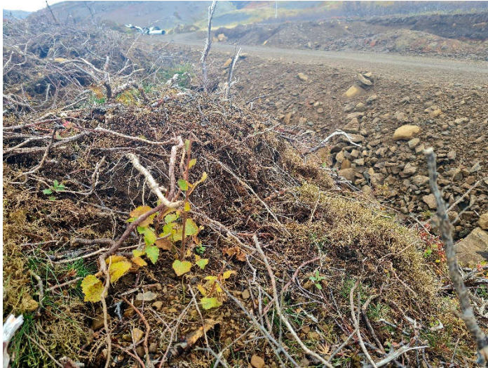
Óflugt rótarskot af birki í svarðlagshaug sem bíður frágangs.