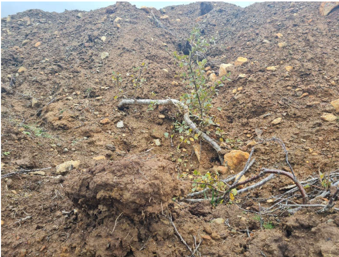
Rótarskot af birki í svarðlagshaug.