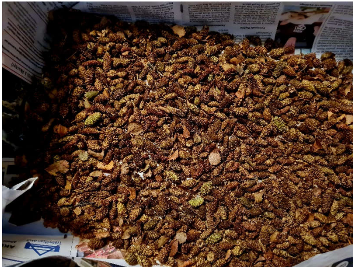
Birkifræ í þurrk