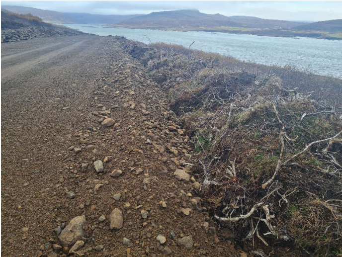
Svarðlag í vegfláa. Frágangur eftir.