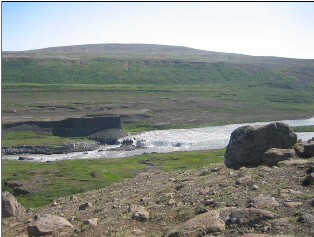
Mynd 7. Hólmatungur, útsýni að Réttarfossi frá Ytra-Þórunnarfjalli (Ljósmynd: HA, 2009).

Viðhald og rekstur á Dettifossvegi mun fylgja þeim viðmiðunar- og vinnureglum sem almennt eru viðhafðar á vegakerfinu og byggjast m.a. á vegflokkum, umferð o.þ.h. Samgönguráðuneytið (samgönguráðherra) ákvarðar snjómokstursreglur.