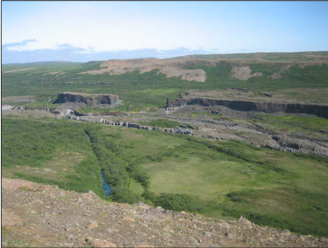
Mynd 2. Hólmatungur vestan Jökulsár og Forvöð austan ár, útsýni frá fyrirhuguðum útsýnisstað á Ytra-Pórunnarfjalli.

Miðað er við að lagður verði um 300 m langur göngustígur, helst malbikaður, frá bílastæðinu að fyrirhuguðum útsýnisstað á Ytra-Pórunnarfjalli.