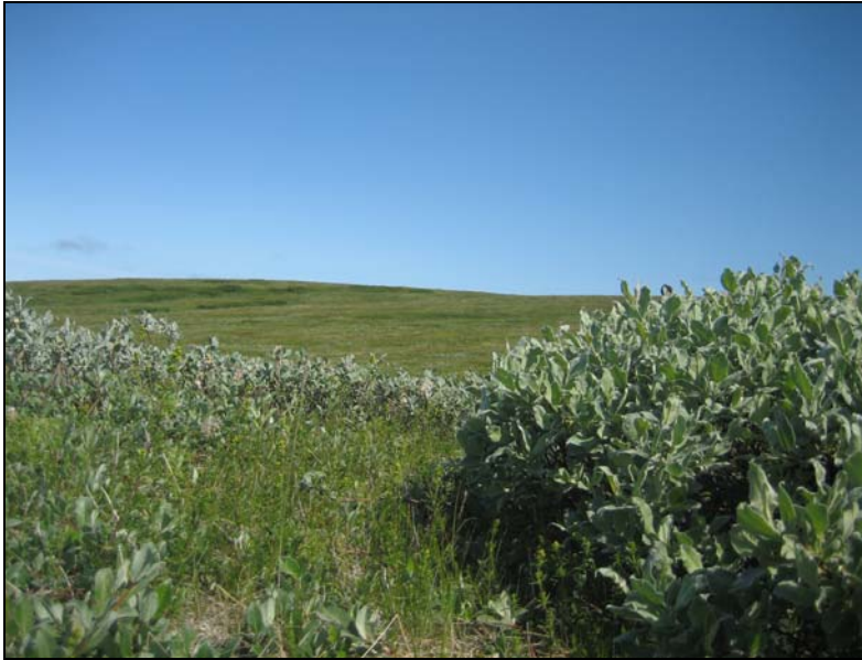
Mynd 5. Langavatnshöfði, horft frá rofabarði.

Bílastæðið verður vestan í Langavatnshöfða og bílar sem verður lagt þar munu ekki sjást frá Vesturdal, Hljóðaklettum eða Rauðhólum.