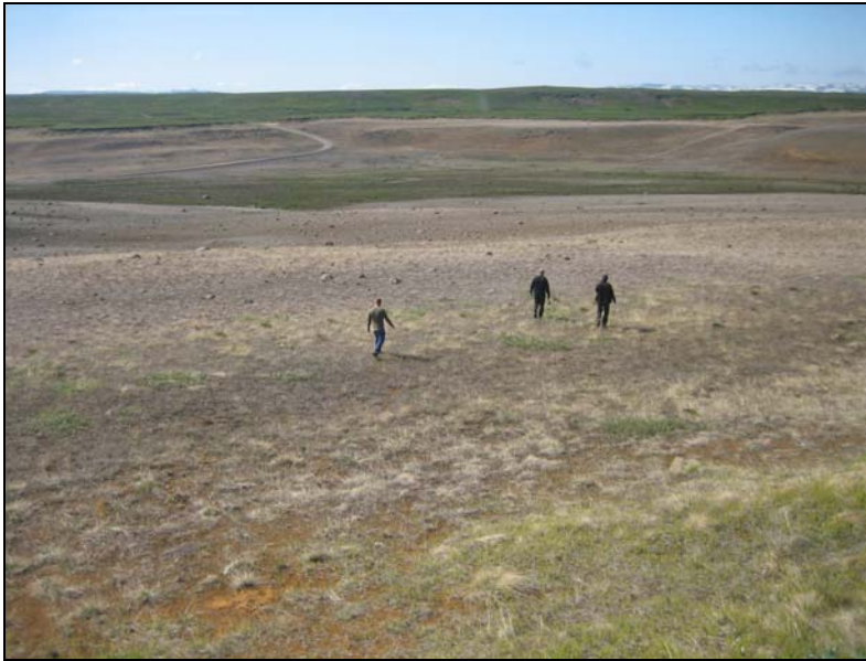
Mynd 3. Horft til vesturs í grennd við stöð 1000 í veglínu tengingar að Langavatnshöfða. Núverandi vegur niður í Vesturdal efst til vinstri.

Ný vegtenging að Vesturdal og Hljóðaklettum verður við stöð 38800 á Dettifossvegi (teikning 5). Veglínin fylgir núverandi Vesturdalsvegi til að byrja með, eða að stöð 400. Þaðan stefnir veglínin upp á Langavatnshöfða í stað þess að fara niður í Vesturdal. Til að byrja með fer veglínin yfir uppgræðslusvæði, en við stöð 1000 er hátt moldarbarð og liggur veglínin þaðan á lyngi grónum móum. Talsverð hækkun er í veglínunni og því þarf hún fara í stórum sveigjum upp á Langavatnshöfða, til að veghalli verði ekki of mikill. Veglínin endar við stöð 1440 og þar er gert ráð fyrir stóru bílastæði fyrir gesti þjóðgarðsins.