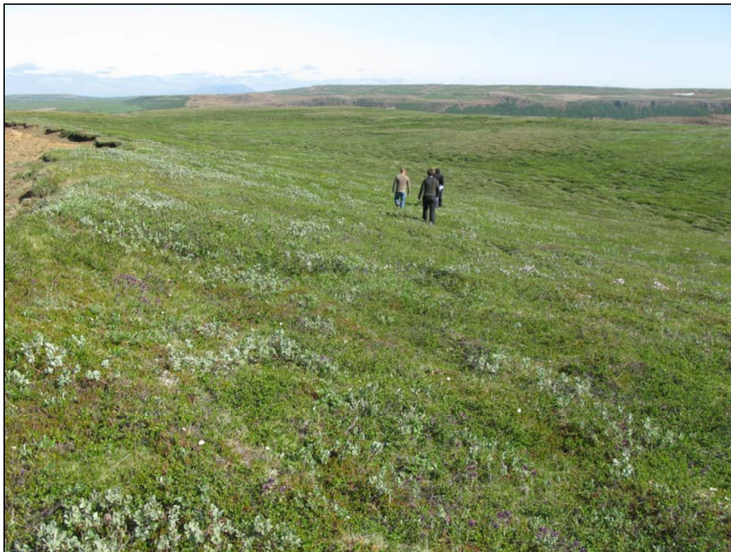
Mynd 1. Ný tenging að Hólmatungum, horft til austurs í stöð 2350 (Ljósmynd: Heimir F. Guðmundsson, 2009).

Bílastæðið verður í lægð í landinu og lítið áberandi frá nálægum útsýnisstöðum og mun ekkert sjást frá Hólmatungum.