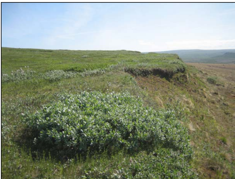
Mynd 4. Rofabarð við stöð 1000 (Ljósmynd: HA, 2009).