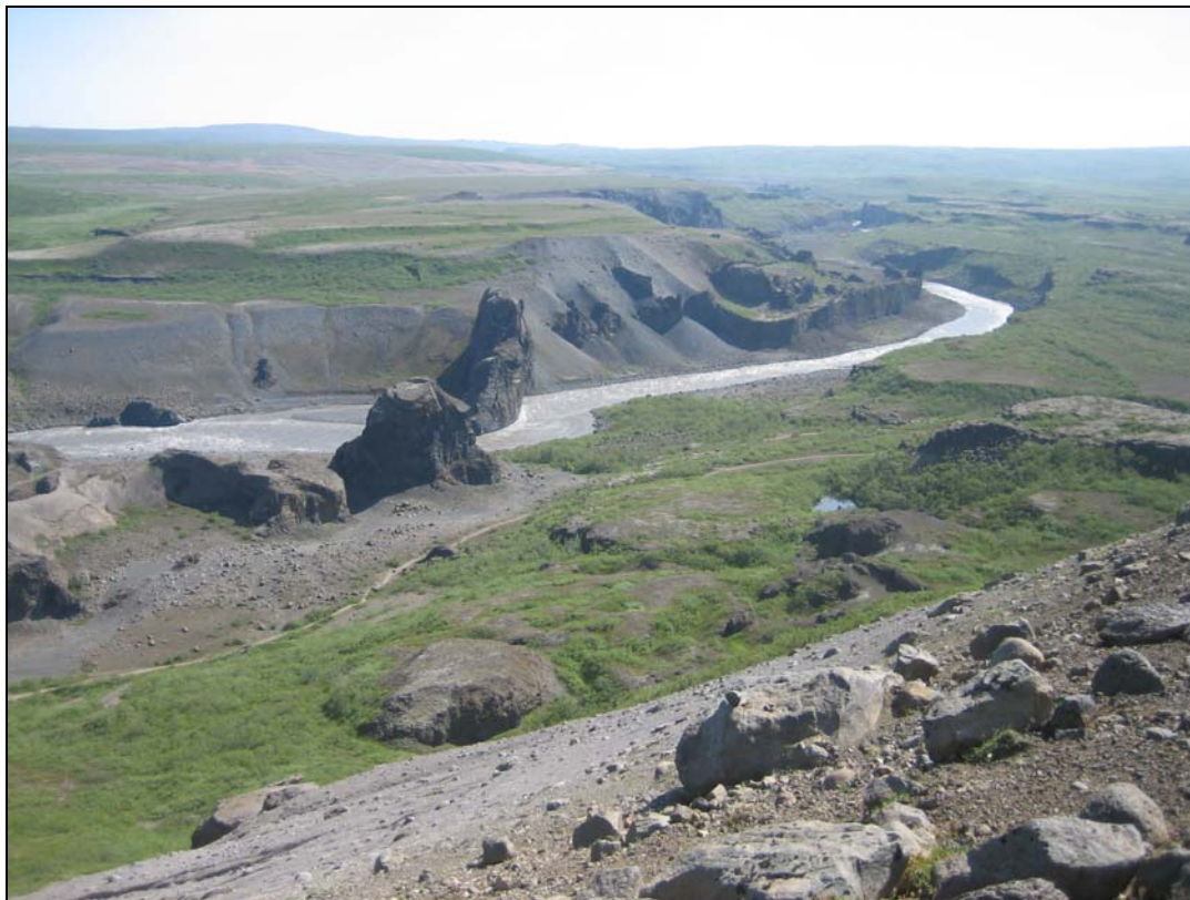
Mynd 9. Hljóðaklettur og Jökulsárgljúfur, útsýni til suðurs frá Langavatnshöfða.