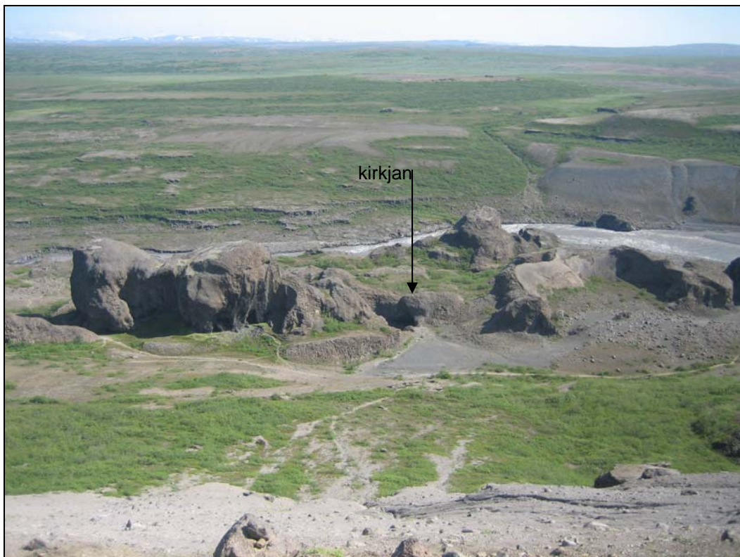
Mynd 6. Hljóðaklettar, útsýni frá fyrirhuguðum útsýnisstað á Langavatnshöfða.

Miðað er við að lagður verði um 250 m langur göngustígur, helst malbikaður, frá bílastæðinu að fyrirhuguðum útsýnisstað á Langavatnshöfða.