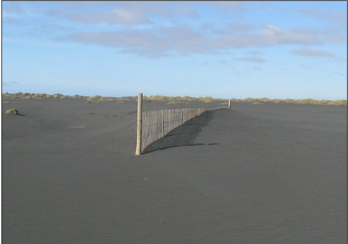
Mynd 2. Fokgirðing á Landeyjasandi gerð úr trérimlum. Girðingin hefur safnað sandi og landið hækkað.