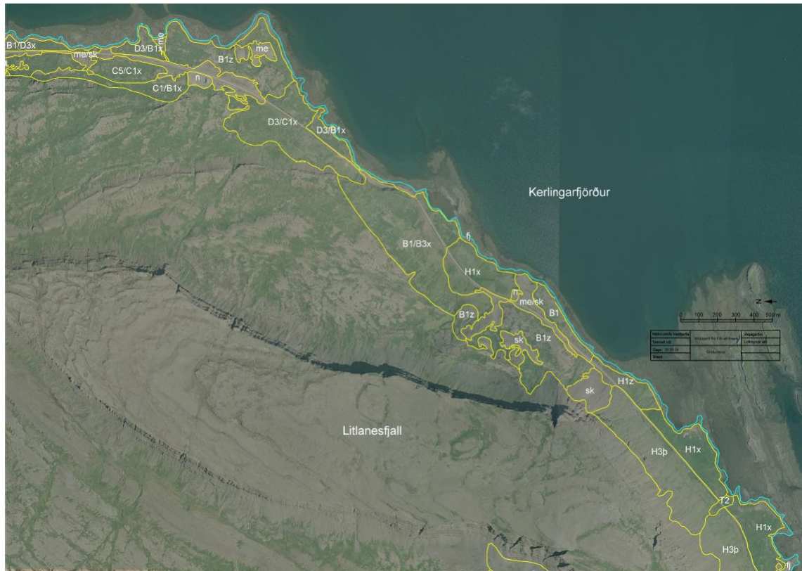
Mynd 6. Gróðurlendi í vestanverðum Kerlingarfirði

á svæðinu frá Vattarfirði og út undir Litlanes er lítil sem engin sauðfjárbeit og hefur ekki verið í nokkurn tíma. Birki og annar gróður, sem sauðfé sækir í, er í framför.