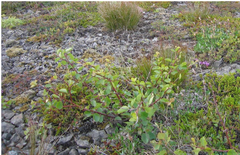
Mynd 3. Birki að koma upp í röskuð svæði við vegöxl

Mjög víða, þar sem jarðvegi hefur verið raskað er að finna sjálfsáðar birkiplöntur, sem eru að koma upp (mynd 3). Vegkantar eru víða vaxnir víði- og birkikjarri.