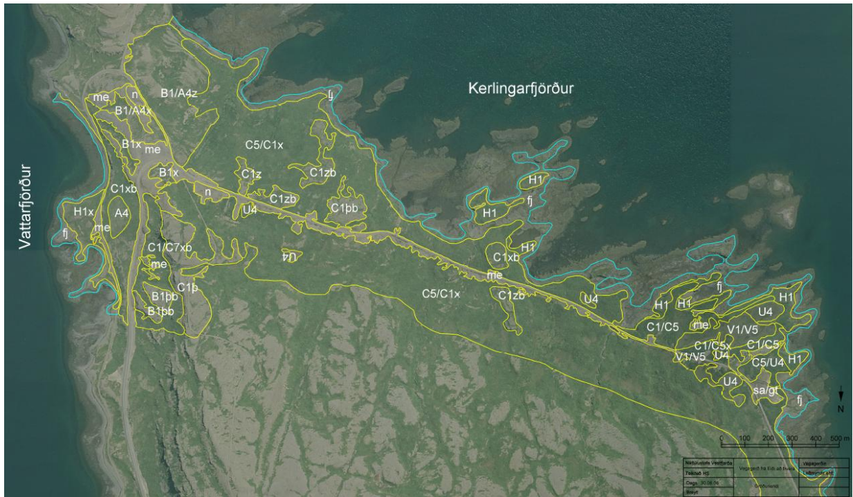
Mynd 2. Gróðurlendi í Kerlingarfirði

Mjög víða, þar sem jarðvegi hefur verið raskað er að finna sjálfsáðar birkiplöntur, sem eru að koma upp (mynd 3). Vegkantar eru víða vaxnir víði- og birkikjarri.