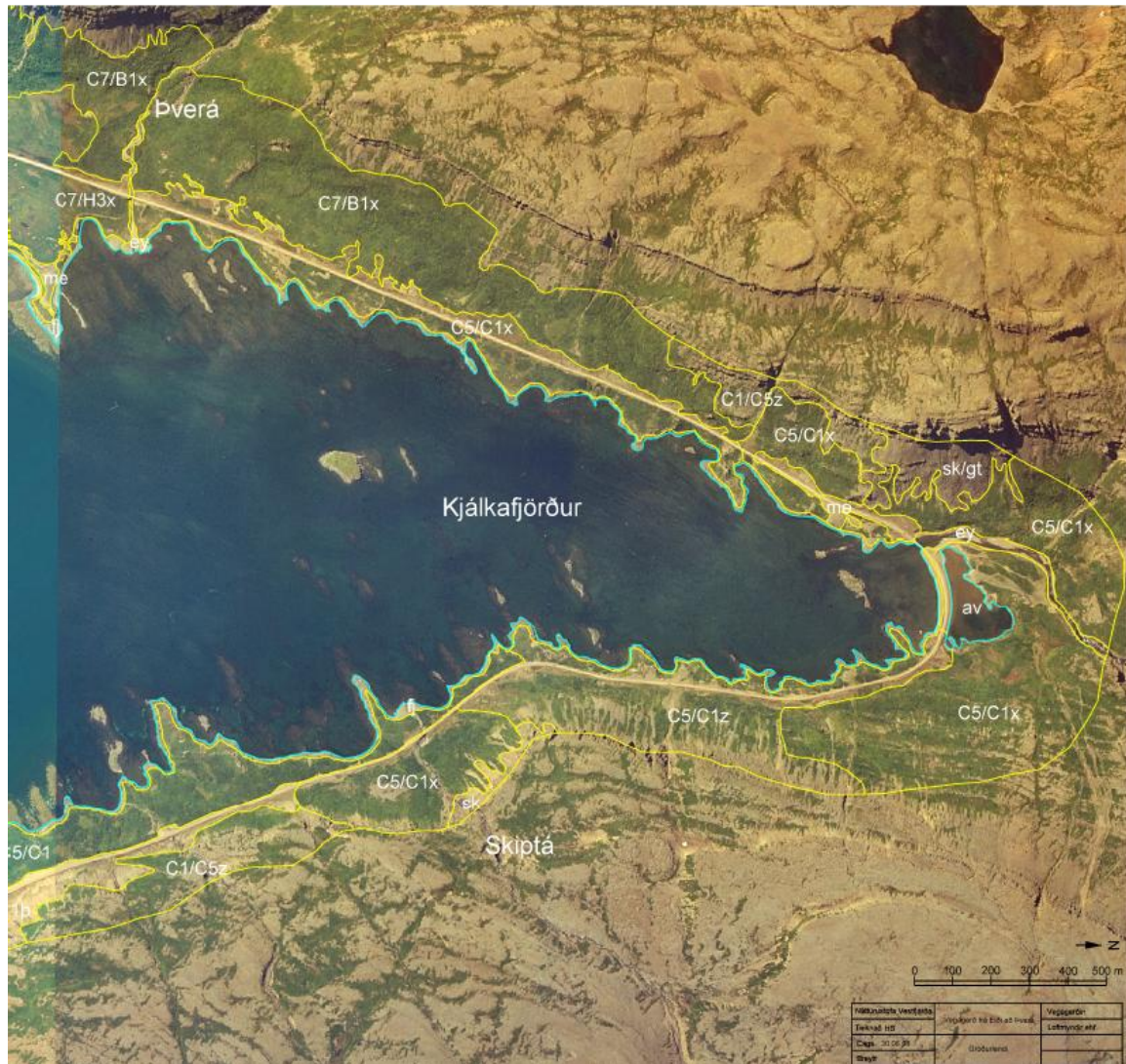
Mynd 9. Gróðurlendi í Kjálkafirði

Inni í Kjálkafirði frá Skiptá að austanverðu og að Þverá að vestanverðu er birkikjarr mest áberandi. Þekja þess er nokkuð misjöfn aðallega vegna kletta í hlíðum fjallanna, sjá mynd 9. Undirgróður er sem fyrr fjalldrapi, krækilyng, bláberjalyng, aðalbláberjalyng og sortulyng.