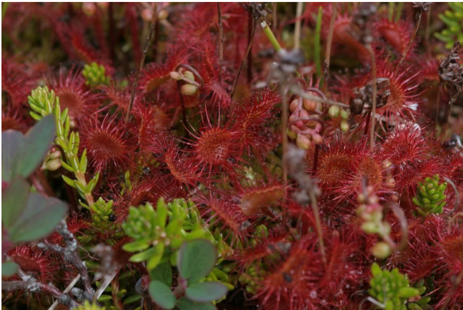
Mynd 8. Sóldögg við Skiptá

Rétt innan Skiptár í austanverðum Kjálkafirði er breiða af sóldögg ( Drosera rotundifolia ) í deiglendi rétt veginn, sjá mynd 8.