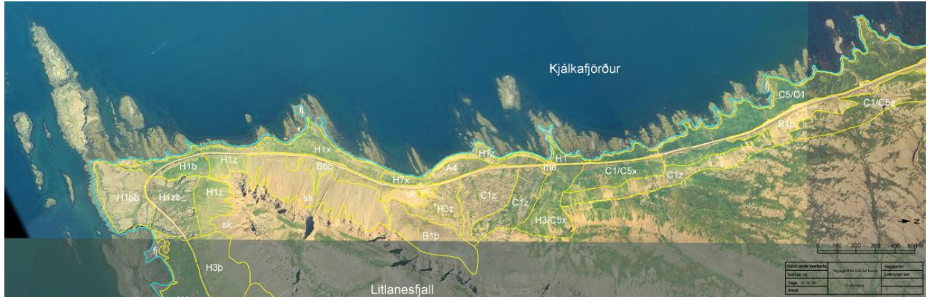
Mynd 7. Gróðurlendi í Kjálkafirði austanverðum

Bærinn Litlanes stóð á Litlanesi yst í Kjálkafirði en Stekkjarnes var aðeins innar. Í kringum þessi bæjarstæði er graslendi, annars er graslendi að mestu blandað lynggróðri. Þegar innar dregur tekur við birkikjarr neðan núverandi vegar en kjarrið er slitróttara og yfirleitt lávaxnara ofan vegar. Upp undir fjallabrúnum er lyngmóagróður með krækilyngi, holtasóley, ljónslappa og bláberjalyngi, sjá mynd 7.