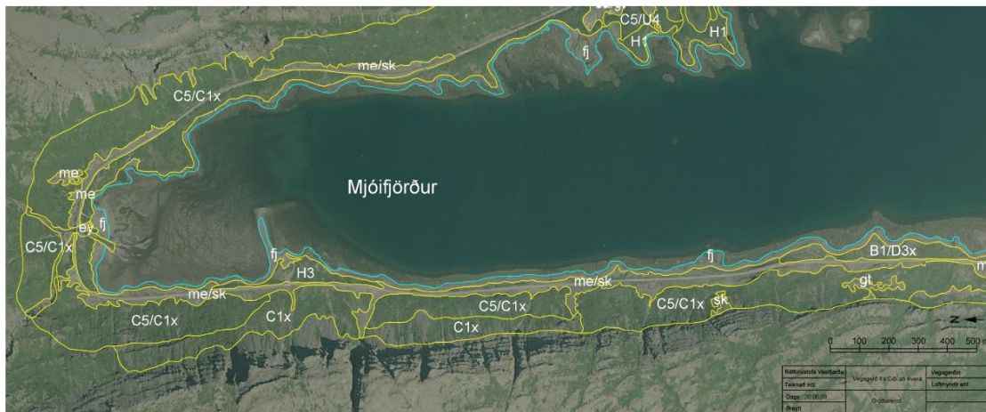
Mynd 5. Gróðurlendi í Mjóafirði

Í Mjóafirði er undirlendi lítið nema í botni fjarðarins. Birkikjarr er að mestu frá fjöru og upp undir kletta, sjá mynd 5. Birkikjarrið er skreytt reynitryám. Undirgróður í birkikjarrinu er blágresi, bláberja- og aðalbláberjalýng, krækilyng, sortulyng og hrútaberjalýng. Einnig er víðir inni á milli og nokkuð er af eski. Landið ber þess merki að