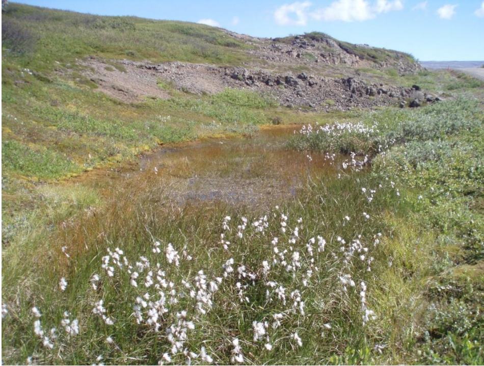
Mynd 4. Tjörn fyrir ofan veg í Kerlingarfirði

vetrarkvíðastör (U4, V1, V5 á mynd 2). Meðfram núverandi vegi eru litlar tjarnir með nokkuð fjölbreyttum gróðri. Þar er m.a. klófífa, gul- og loðvíðir, vatnsnál, dúnurtir og ýmsar starir, sjá mynd 4.