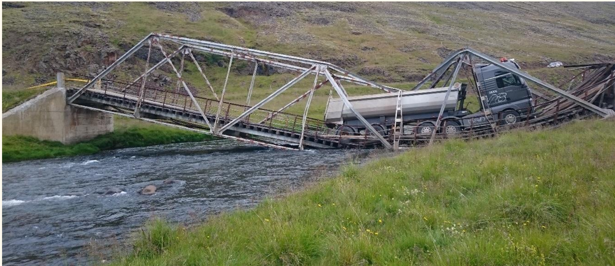
Vatnsdalsá hjá Grímstungu (2015)