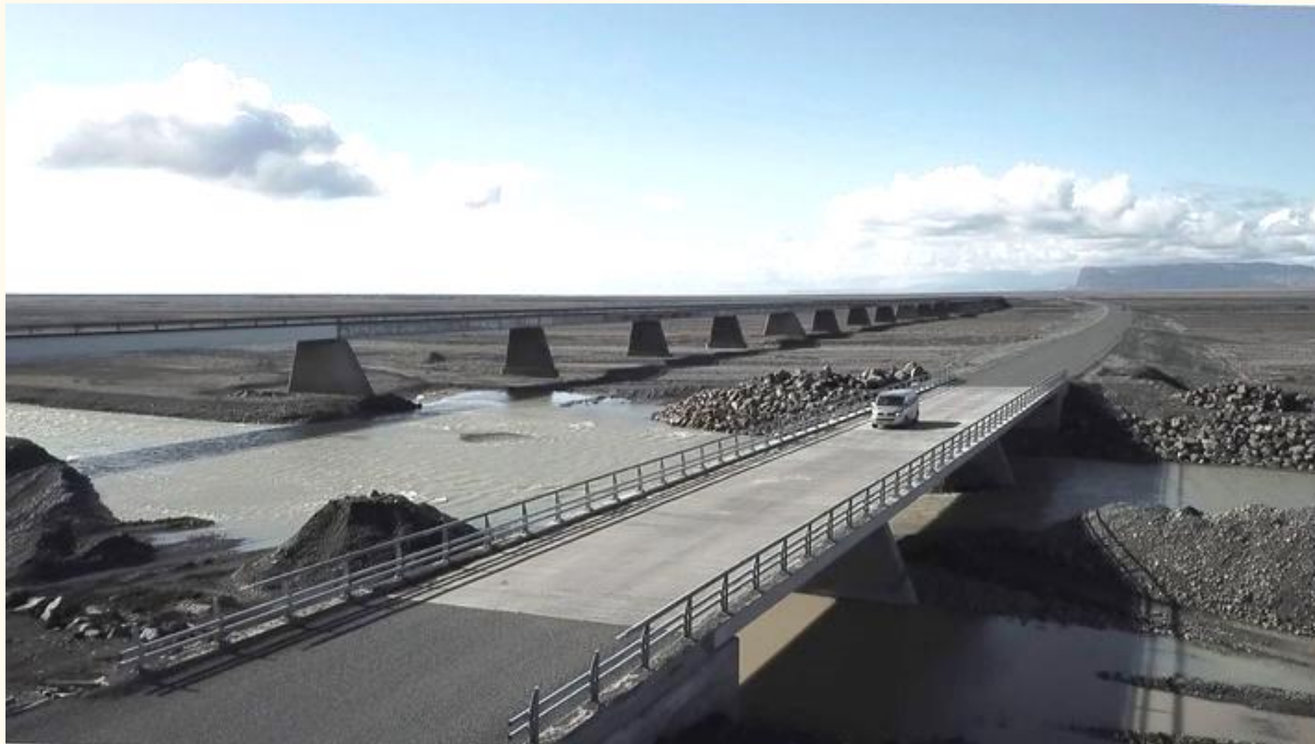
Ný brú á Morsá 2017