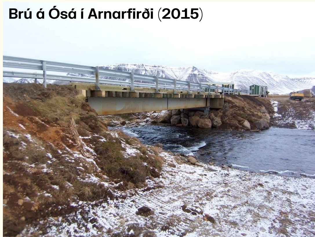
Brú á Ósá í Arnarfirði (2015)