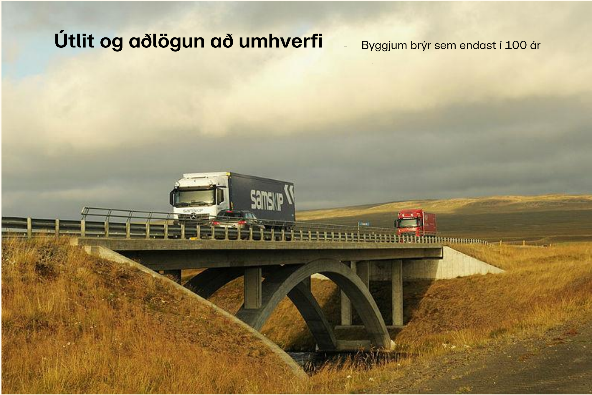
Laxá hjá Laxamýri (2006)