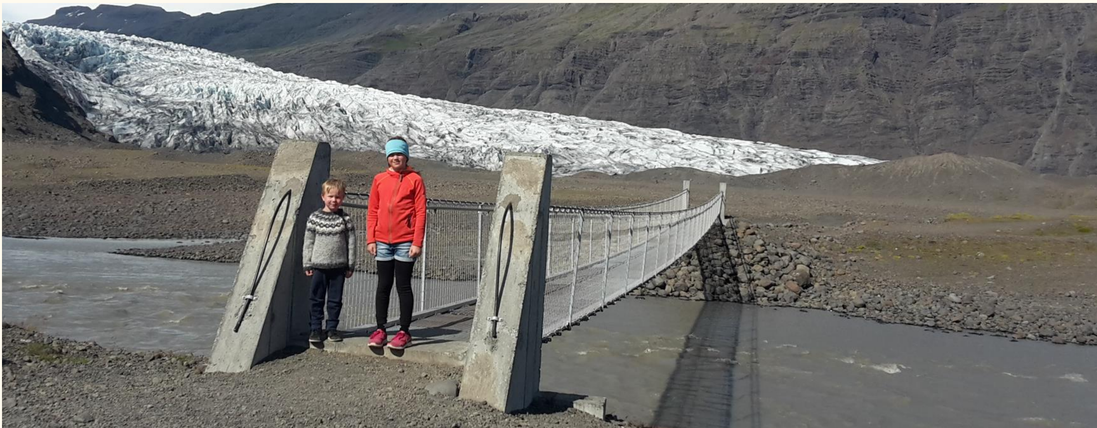
Göngubrú á Hólmsá