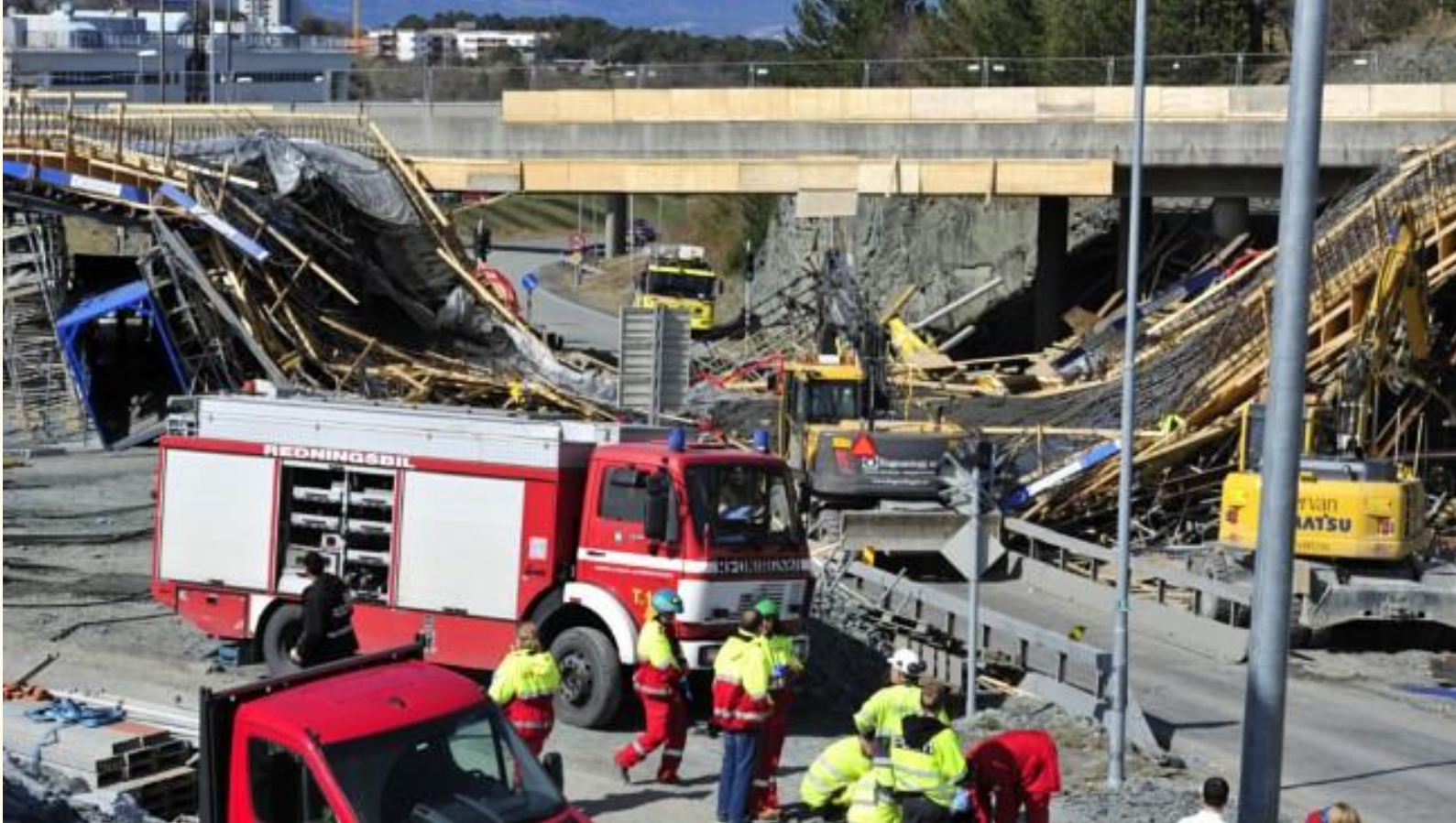
E6 í Þrándheimi (2013)