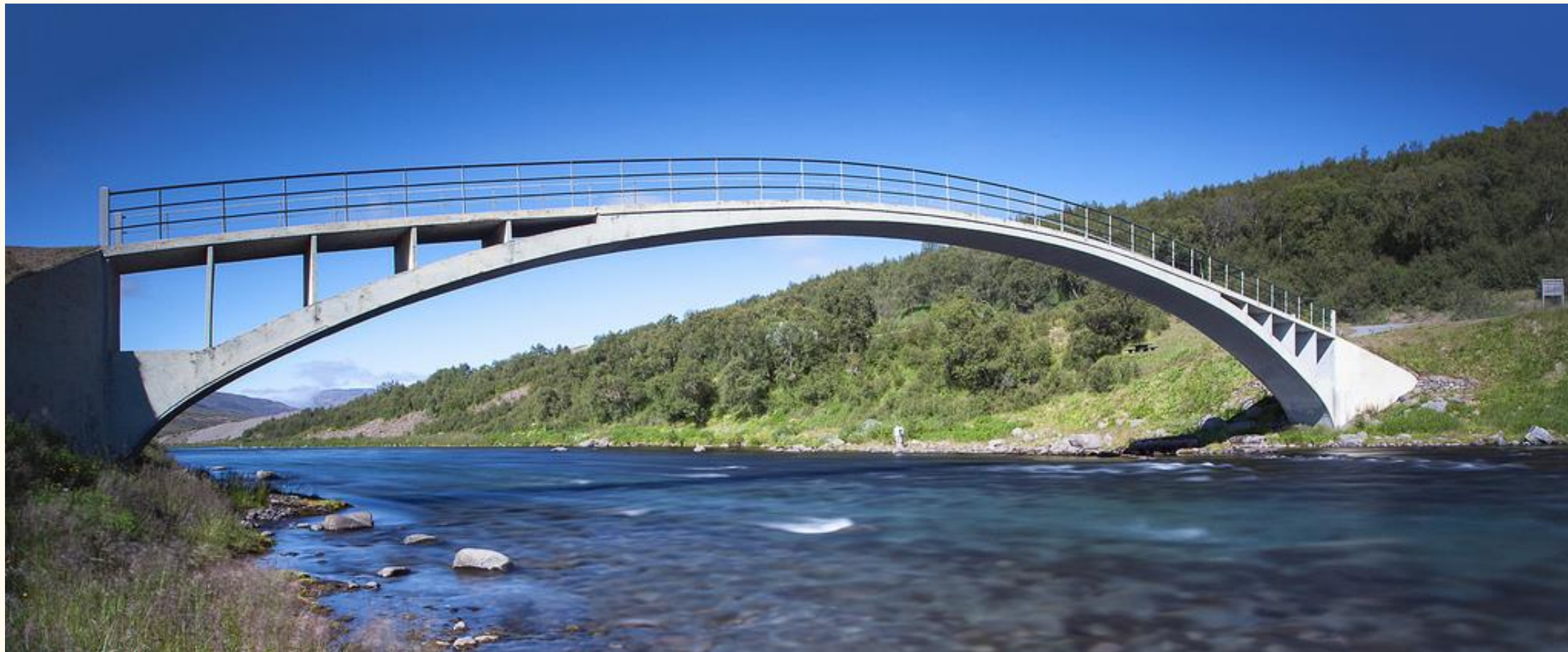
Fnjóská í Vaglaskógi (1908)