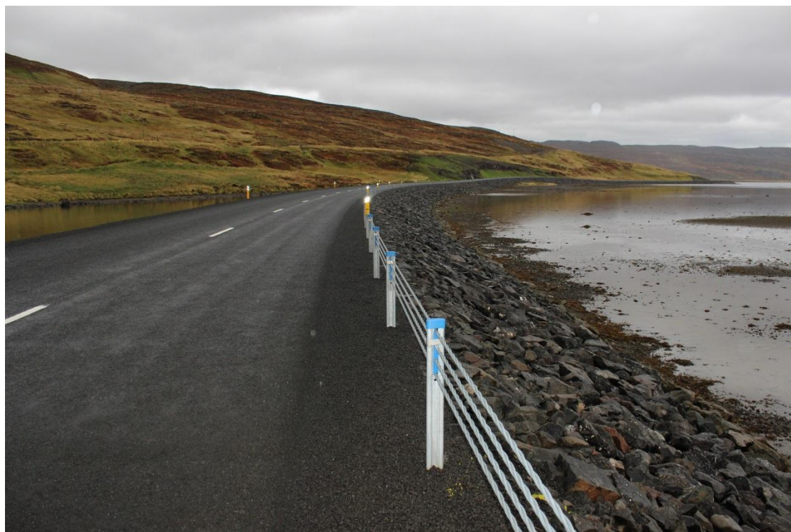
Strandavegur (643), Djúpvegur – Geirmundarstaðavegur.