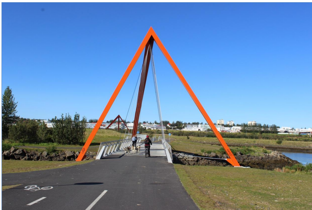
Göngu og hjólabrýr við Elliðaár.

Verkkaupar voru Reykjavíkurborg og Vegagerðin.