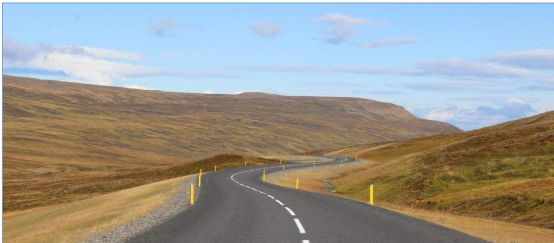
Norðausturvegur (85), tenging Vopnafjarðar við Hringveg.