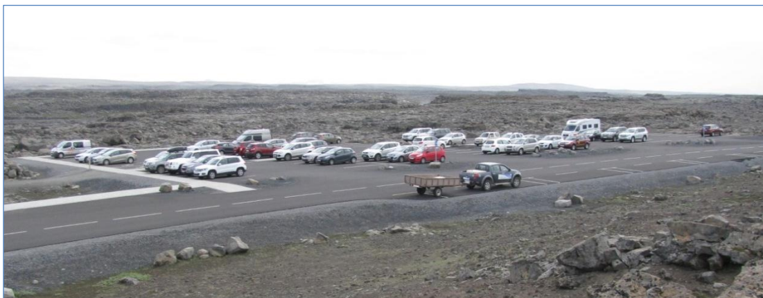
Bílastæði við Dettifoss.