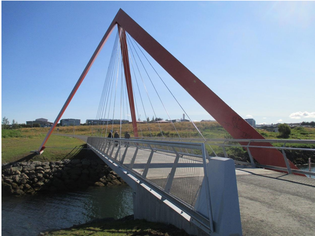
Göngu og hjólabrýr við Elliðaár