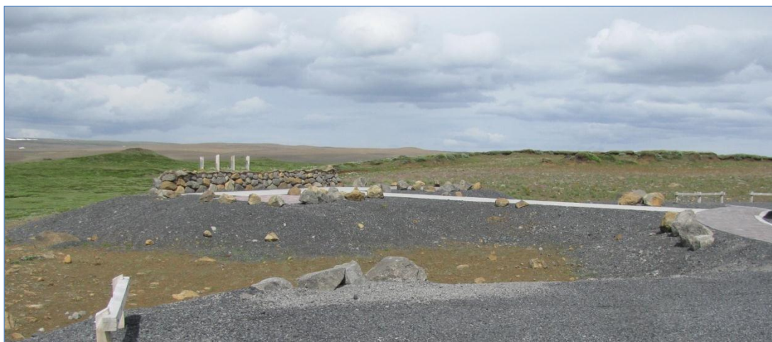
Áningarstaður við Dettifossveg.

Vegurinn er mjög fallegur á kafla þar sem gróðurinn í gömlu sjávarbökkunum hangir fram yfir kletta ofan vegar, en að mati dómnefndar hefði uppgræðslan mátt vera í meira samræmi við umhverfið.