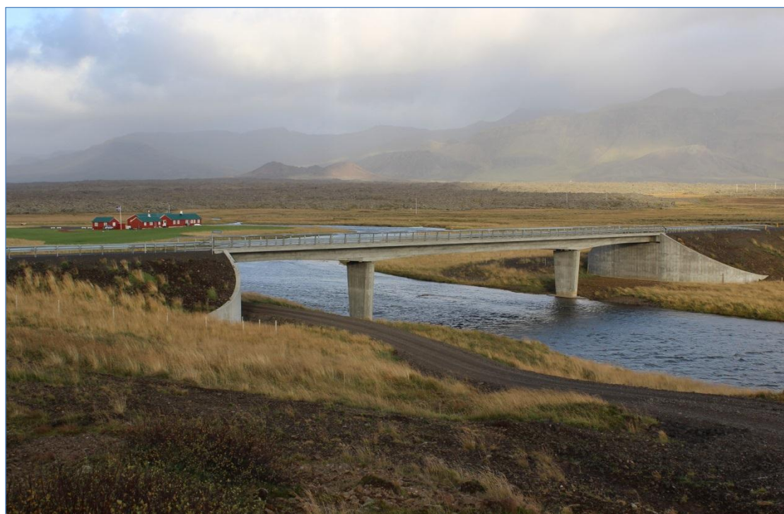
Snæfellsnesvegur (54) um Haffjarðará.