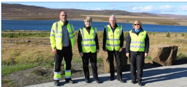
Dórnefndin og ritari að störfum.

Þessi atriði voru síðan vegin saman og heildarniðurstaðan réð vali dórnefndar, sjá matsblað á næstu blaðsíðu.