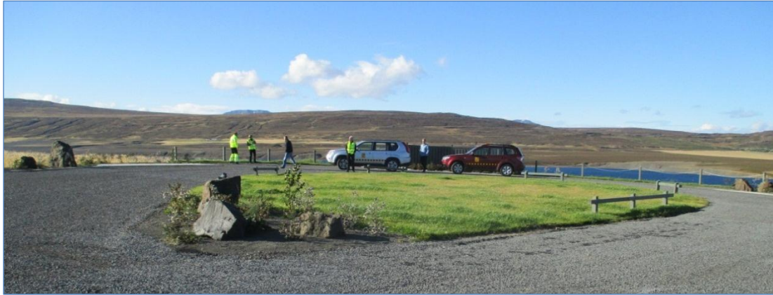
Áningarstaður við Norðausturveg í grennd við Vopnafjörð.