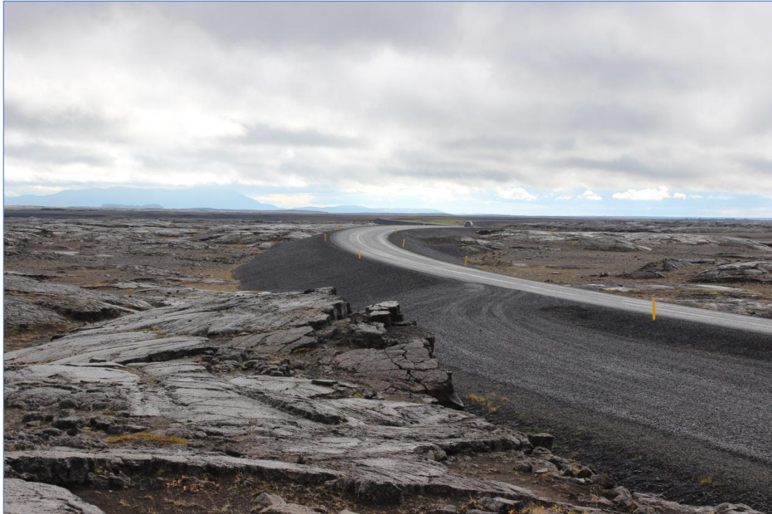
Dettifossvegur (862), Hringvegur – Dettifoss.

Vegurinn liggur um ógróið sandsvæði vestan Jökulsár á Fjöllum. Hann leysti af hólmi niðurgrafinn og hlykkjóttan vegslóða með mörgum blindhæðum og litlu burðarþoli. Vegurinn er uppbyggður og það hefur tekist að fella hann að landslaginu, þannig að náðst hefur fram tæknilega góð veglína sem eykur öryggi vegfarenda, án þess að draga úr upplifun þeirra af sérstöku landslaginu. Frágangur er góður og einfaldur, unninn í samráði við yfirvöld þjóðgarðsins í Jökulsárgljúfrum og Landgræðsluna. Áningarstaður og bílastæði eru vel heppnuð hvað varðar staðsetningu, gerð og frágang.