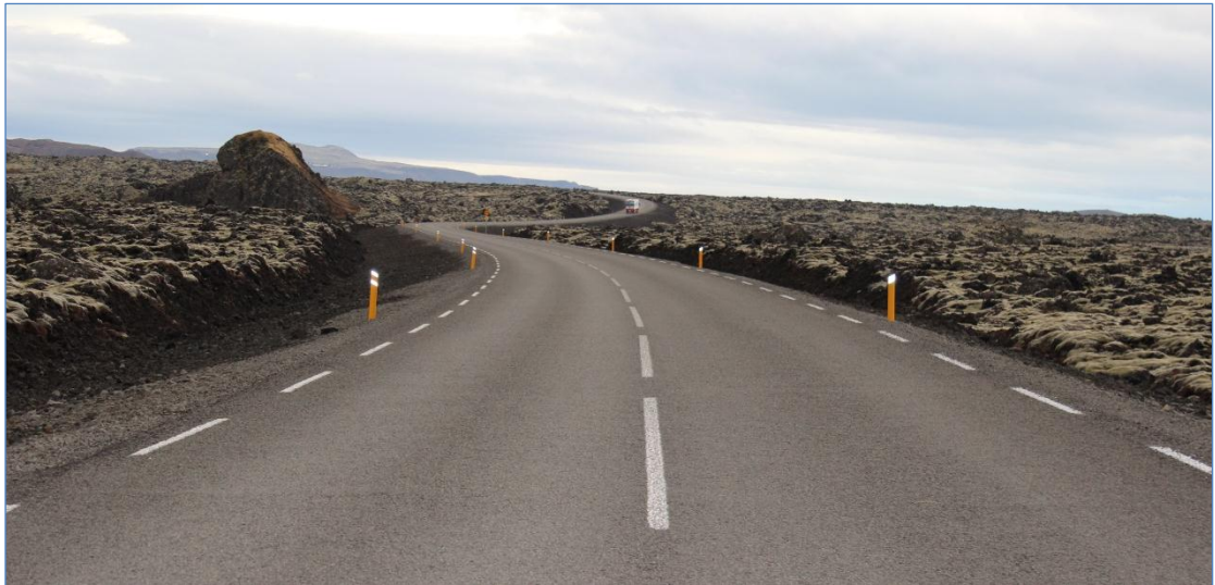
Suðurstrandarvegur (427), Grindavík – Þorlákshöfn.