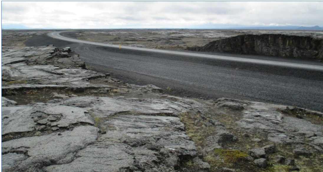
Dettifossvegur (862), Hringvegur – Dettifoss.