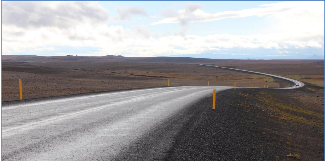
Dettifossvegur (862), Hringvegur – Dettifoss.