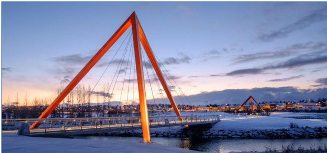
Göngu og hjólabrýr við Elliðaár.