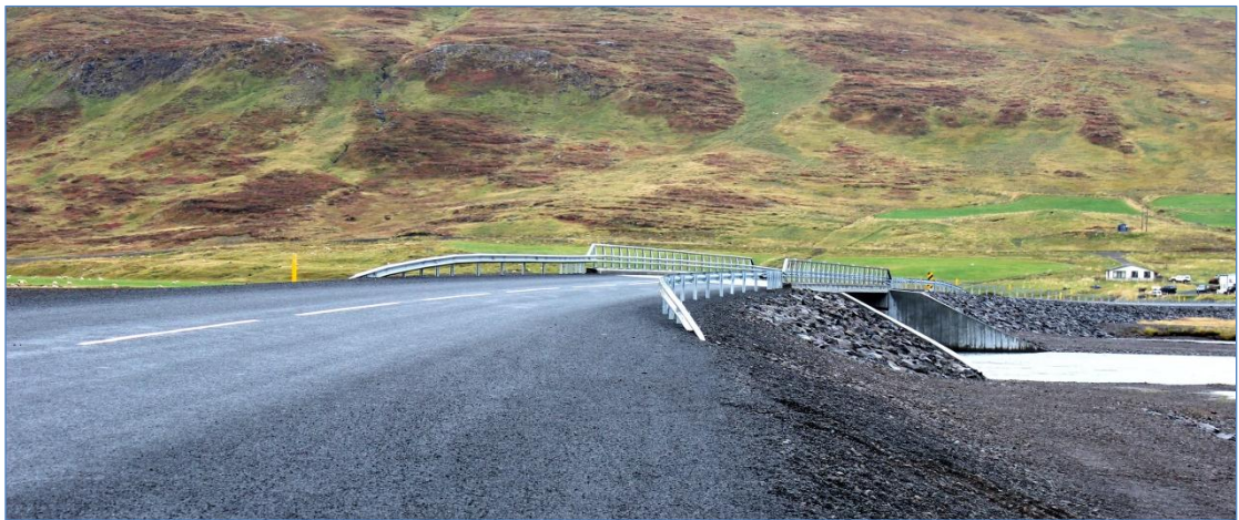
Strandavegur (643), Djúpvegur – Geirmundarstaðavegur.