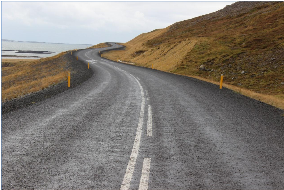
Vestfjarðavegur (60), Þverá – Þingmannaá.