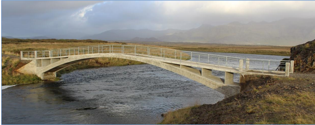
Gömul uppgerð brú yfir Haffjarðará.