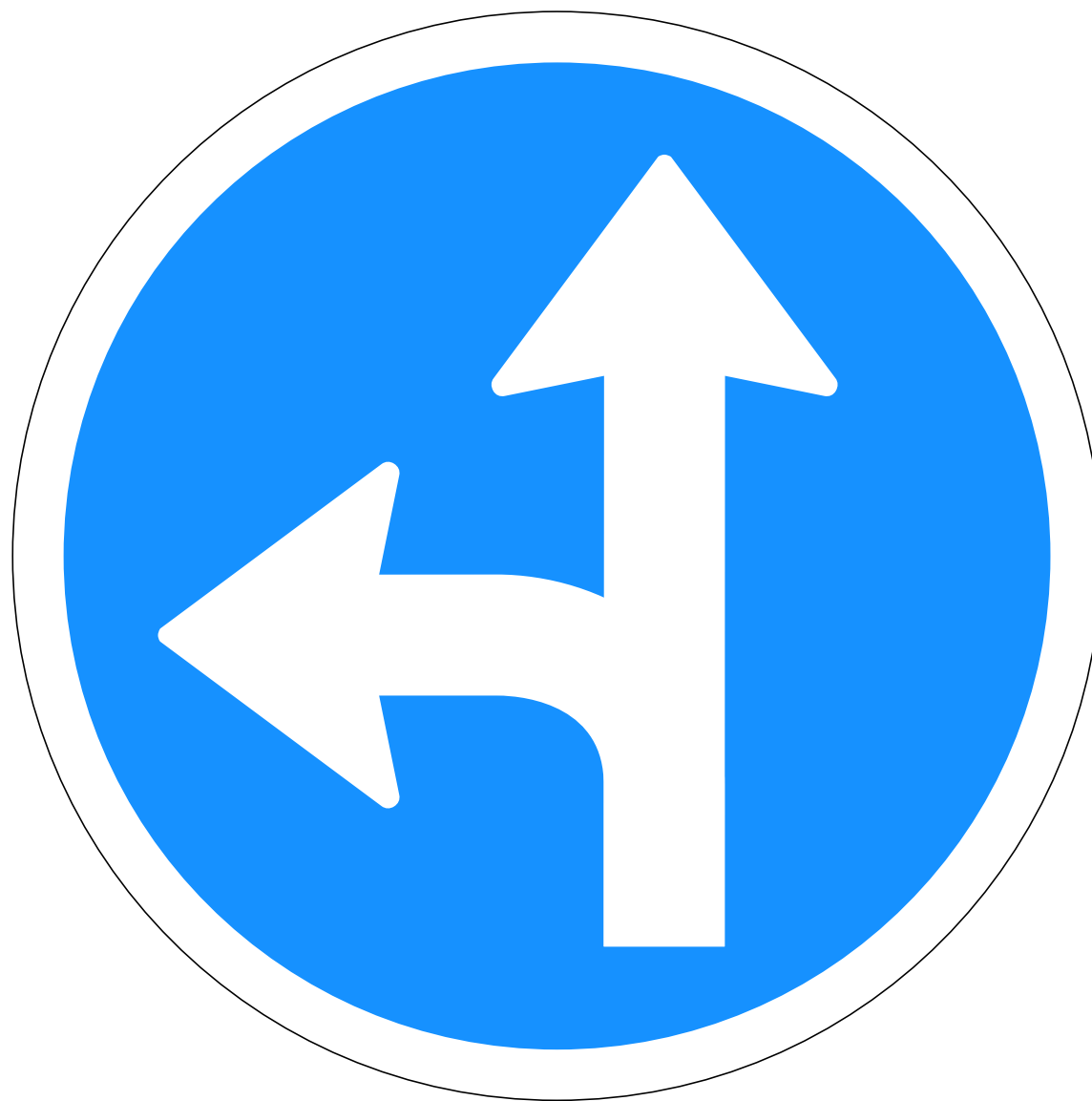
C01.32 Akstursstefnu- merki