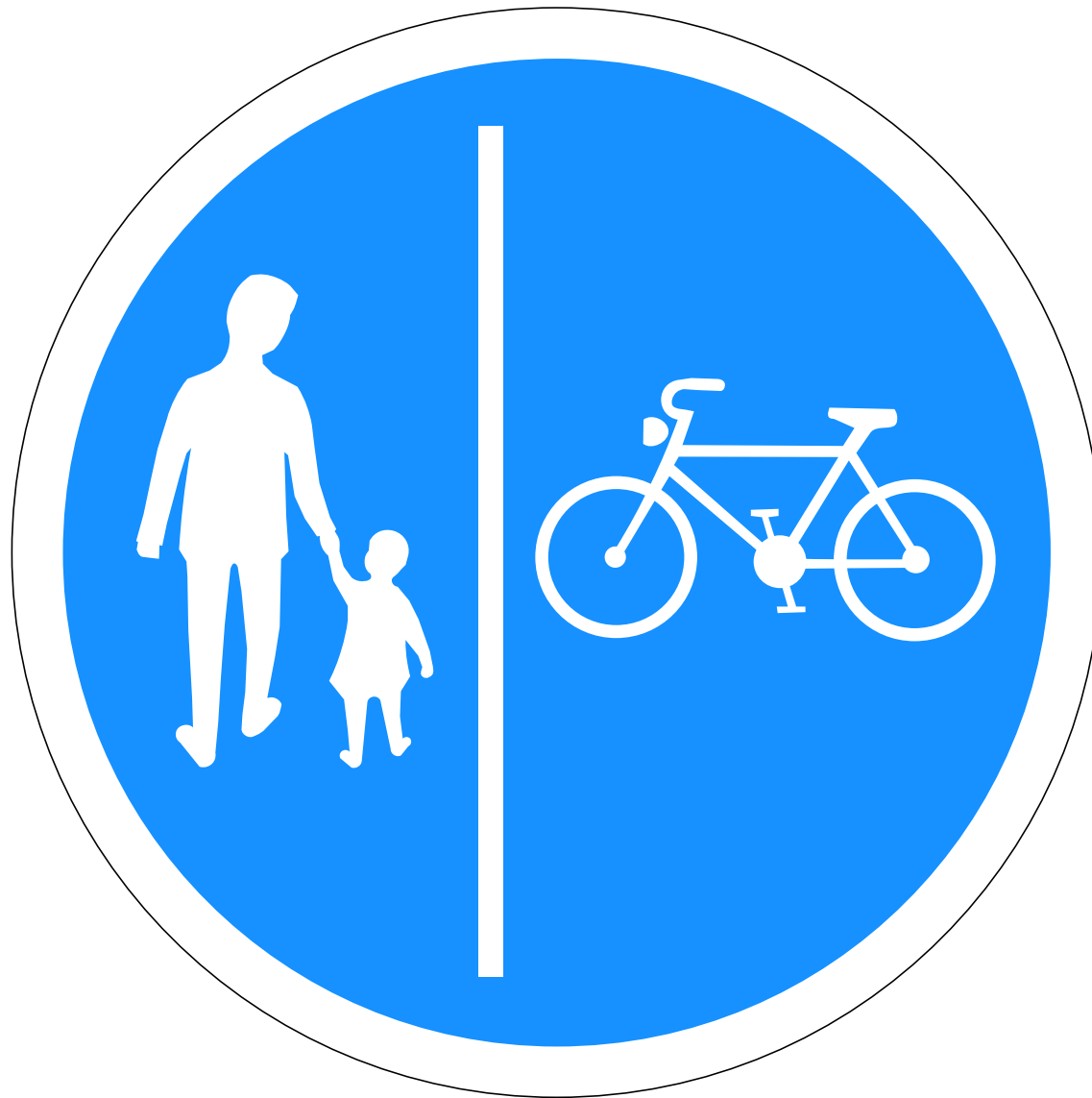
C15.21 Aðgreindir gang- og hjólreiðastígar