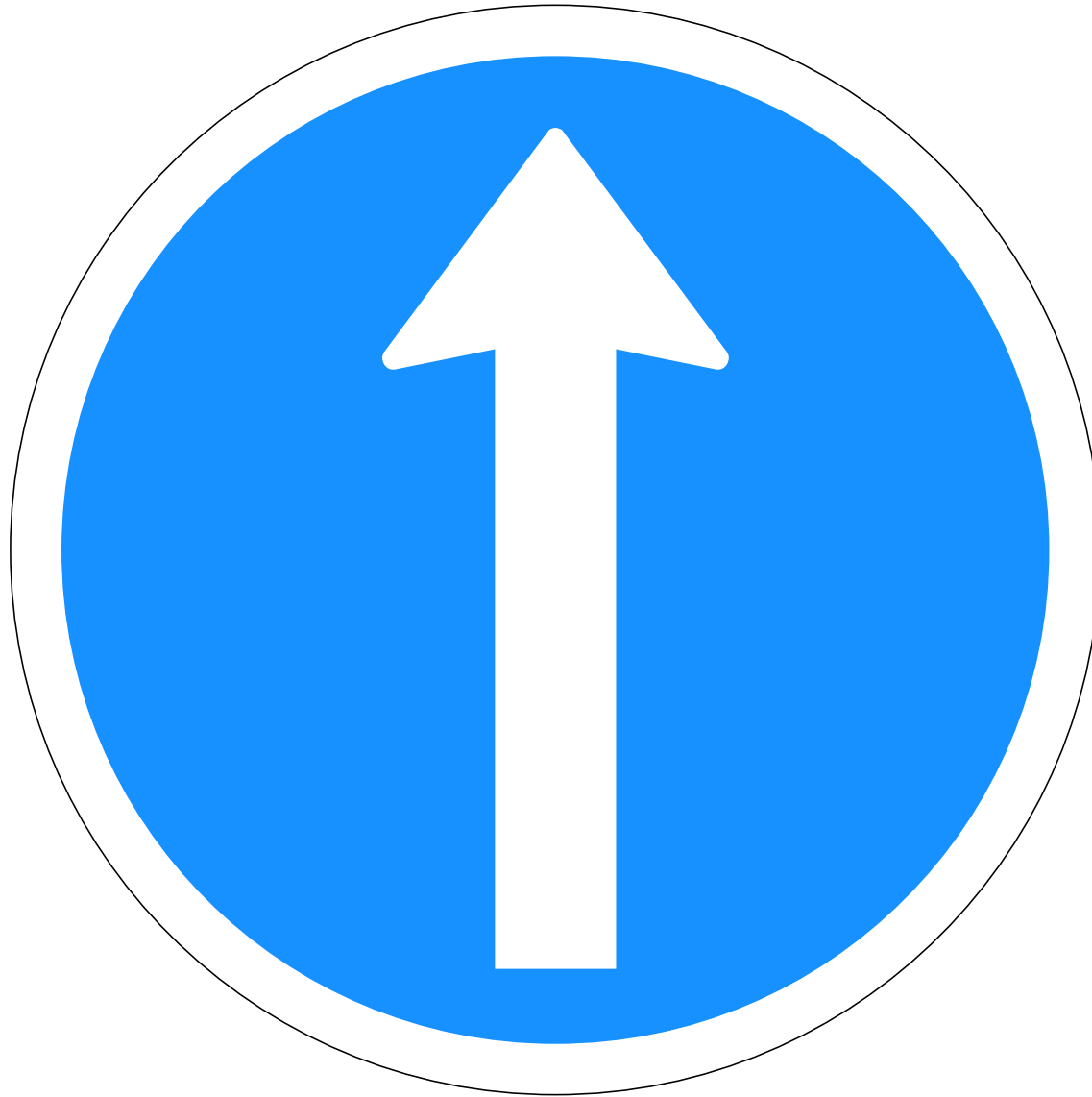
C01.13 Akstursstefnu- merki