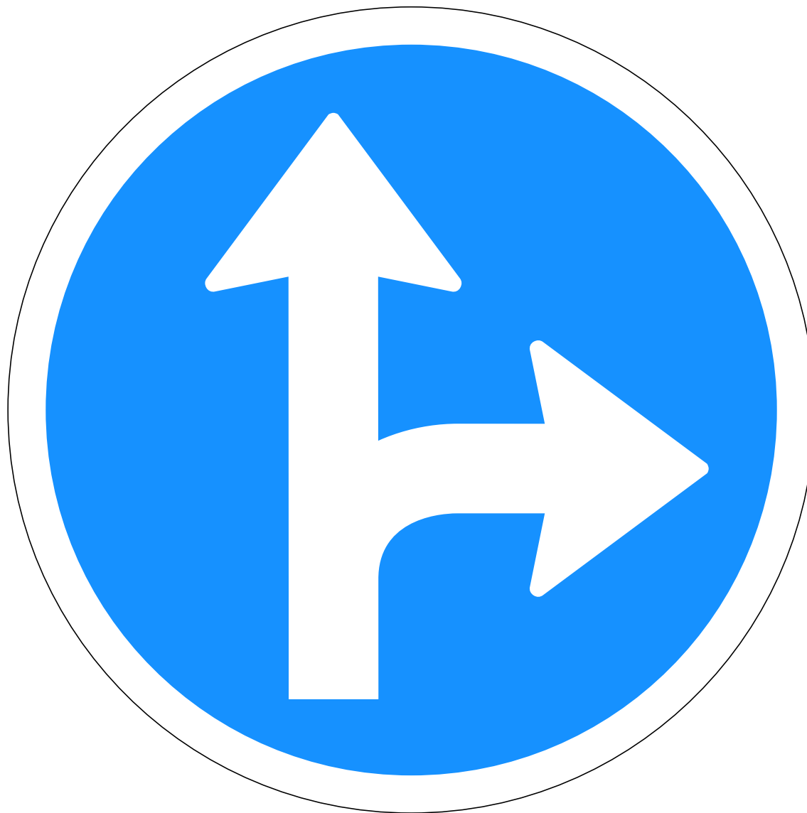
C01.31 Akstursstefnu- merki