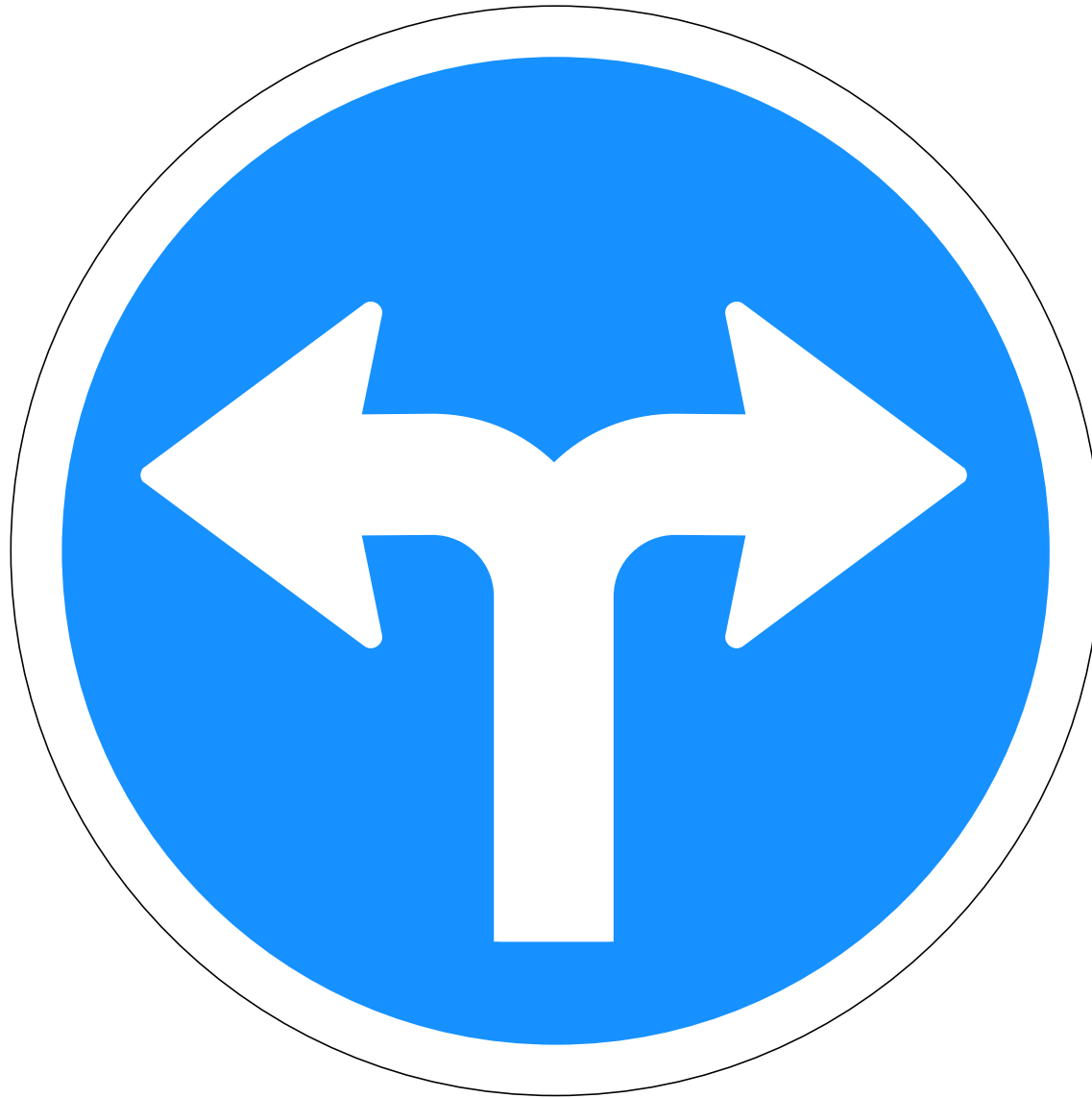
C01.41 Akstursstefnu- merki