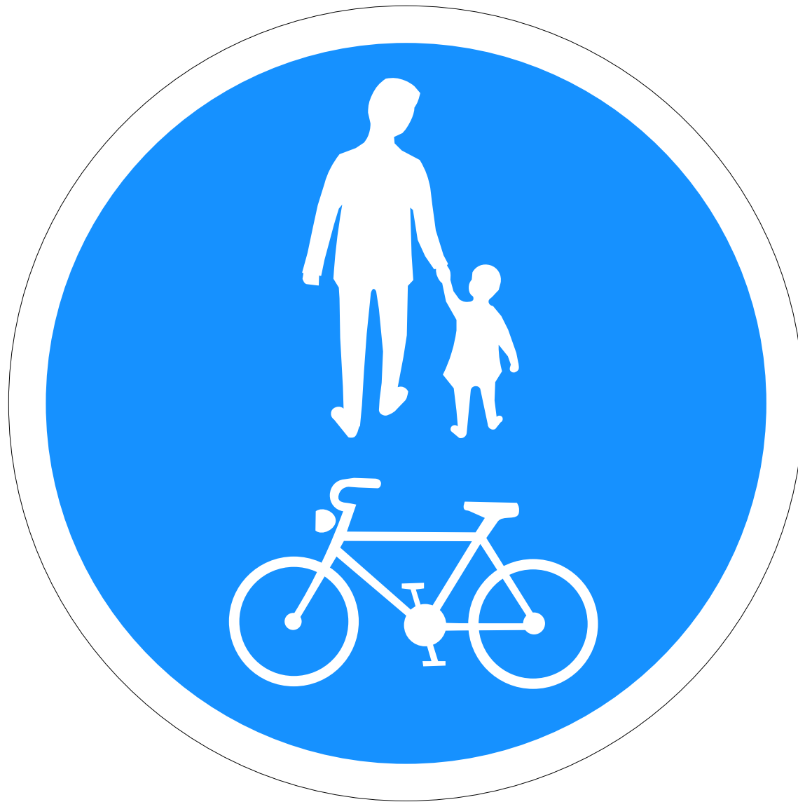
C15,11 Gang- og hjólréiðastígur