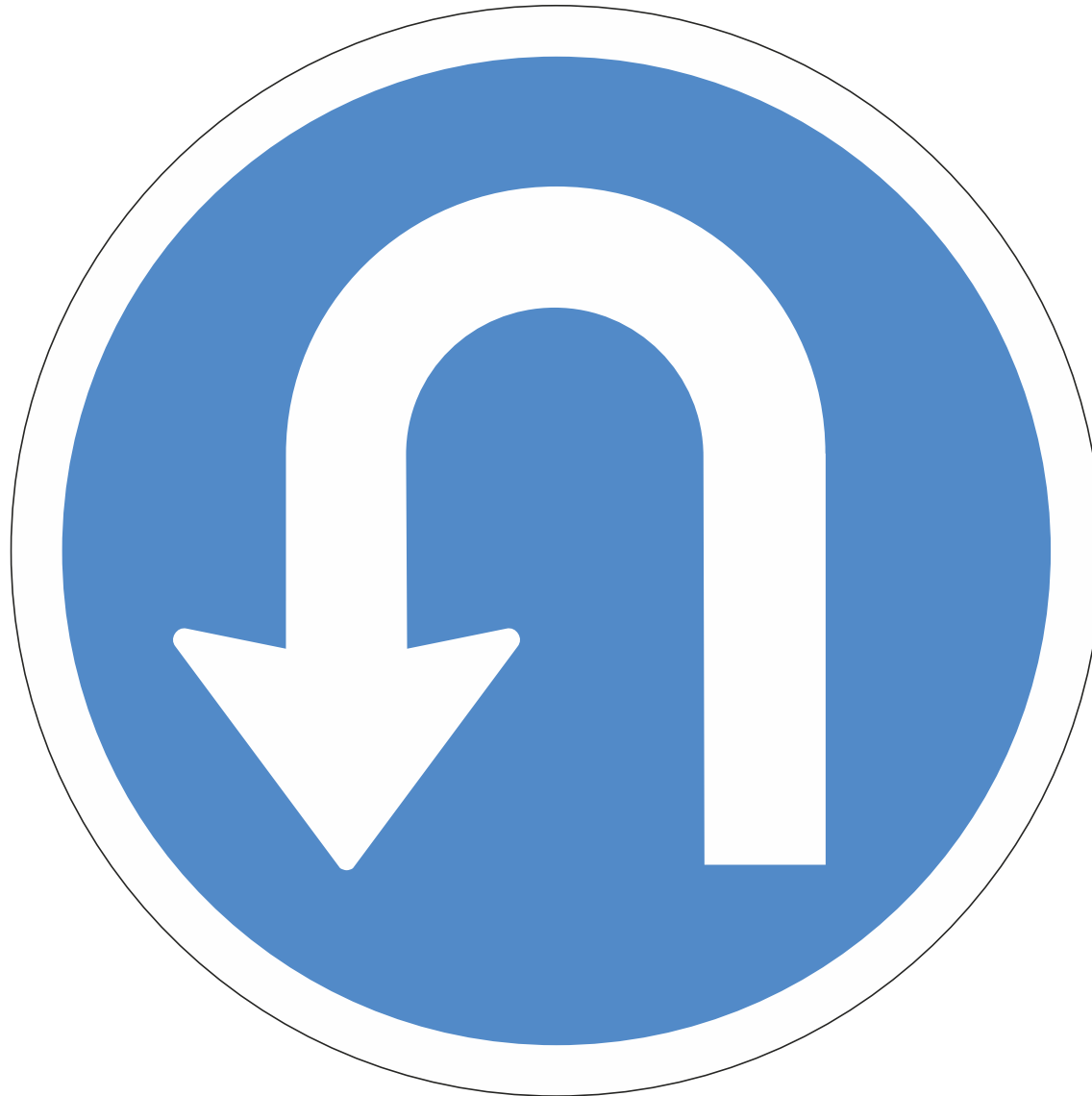
C01.26 Akstursstefnu- merki