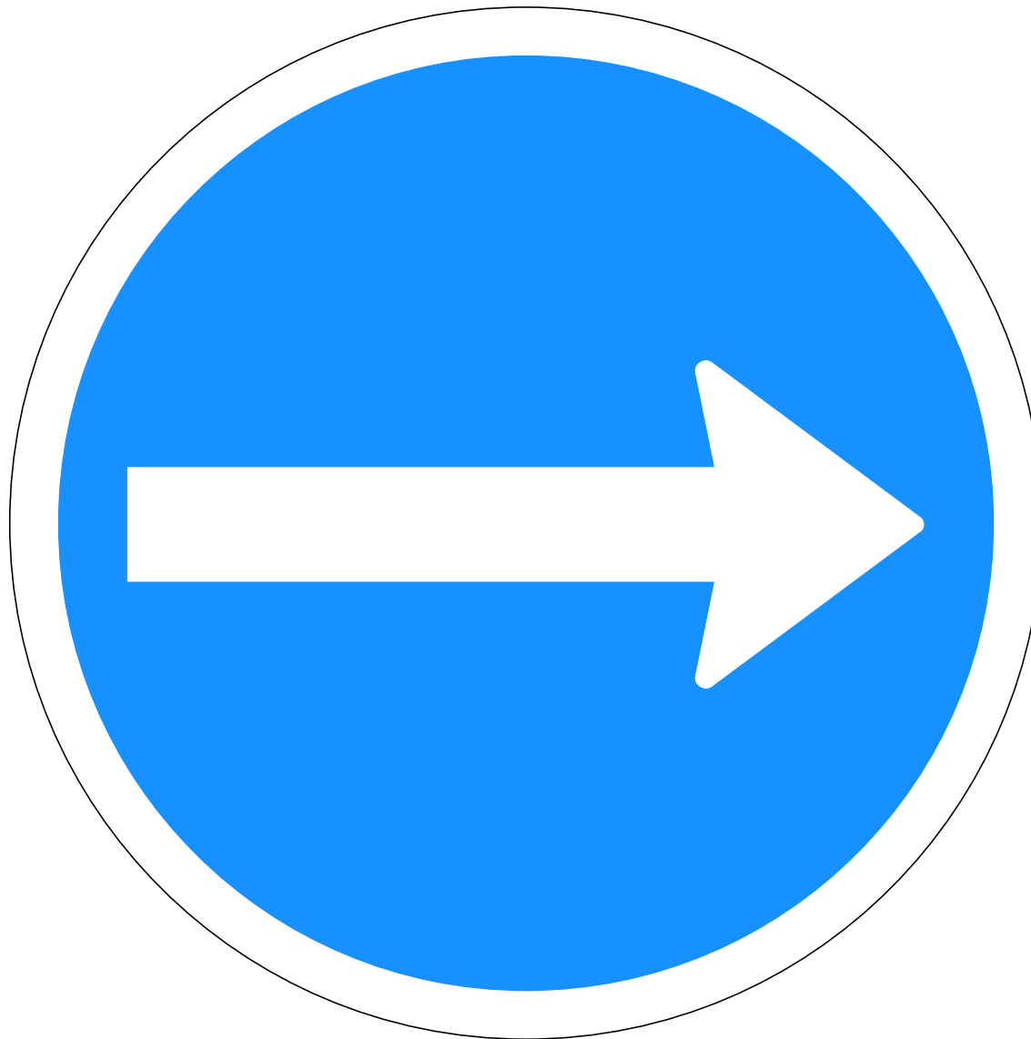
C01.11 Akstursstefnu- merki