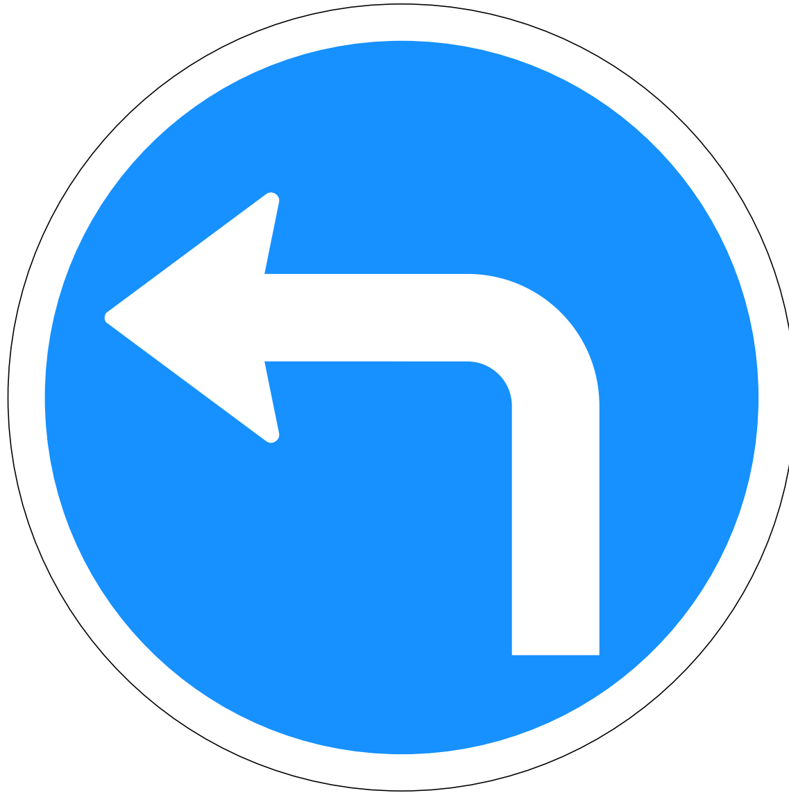
C01.22 Akstursstefnu- merki