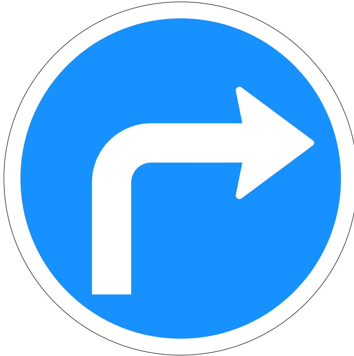
C01.21 Akstursstefnu- merki